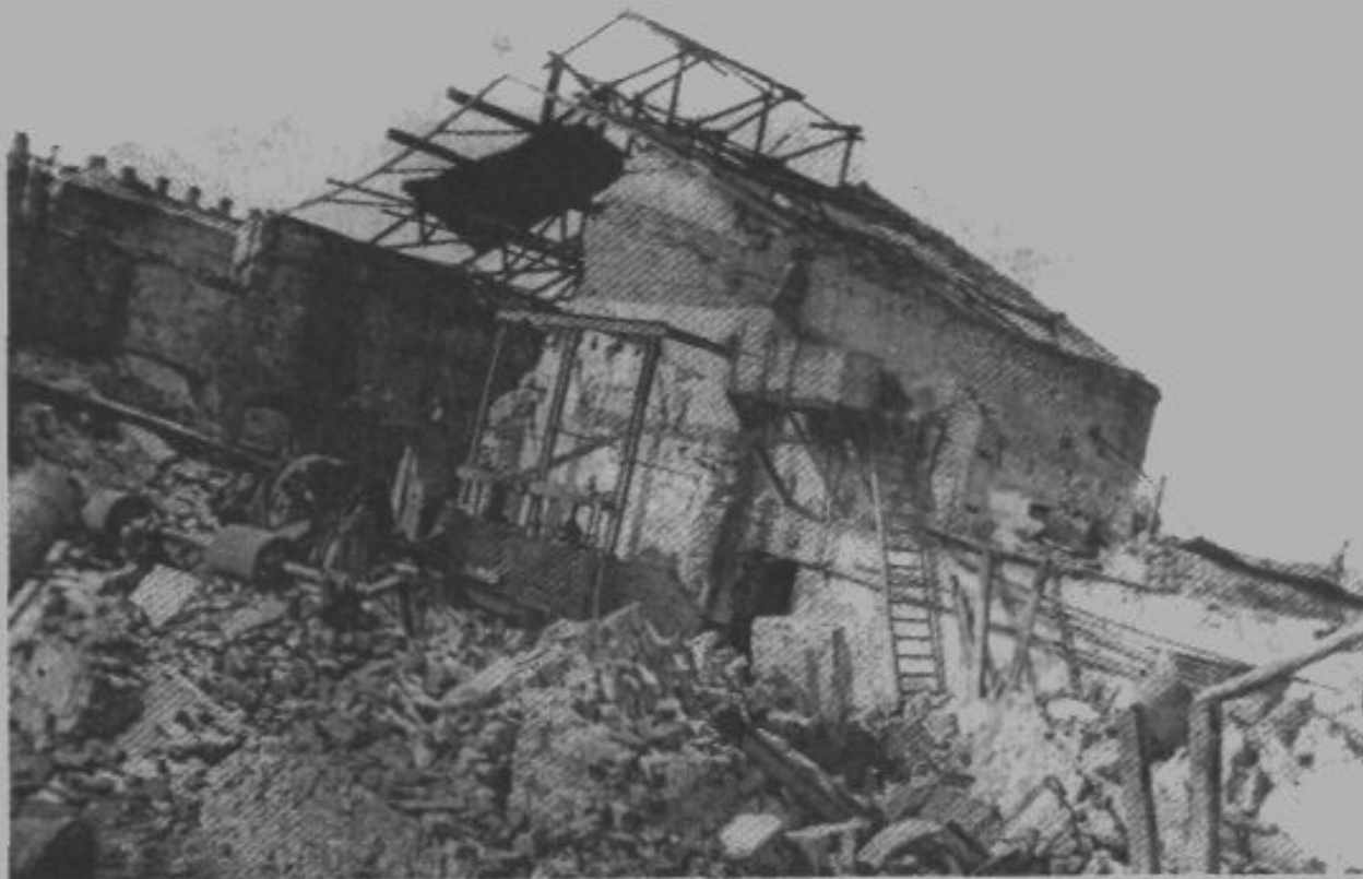
3. Разрушенное здание маслозавода №4. г. Армавир, 1943 г.

В конце июня 1942 года фашисты начали наступление на Волгу и Северный Кавказ. К началу сентября им удалось захватить большую часть Краснодарского края.