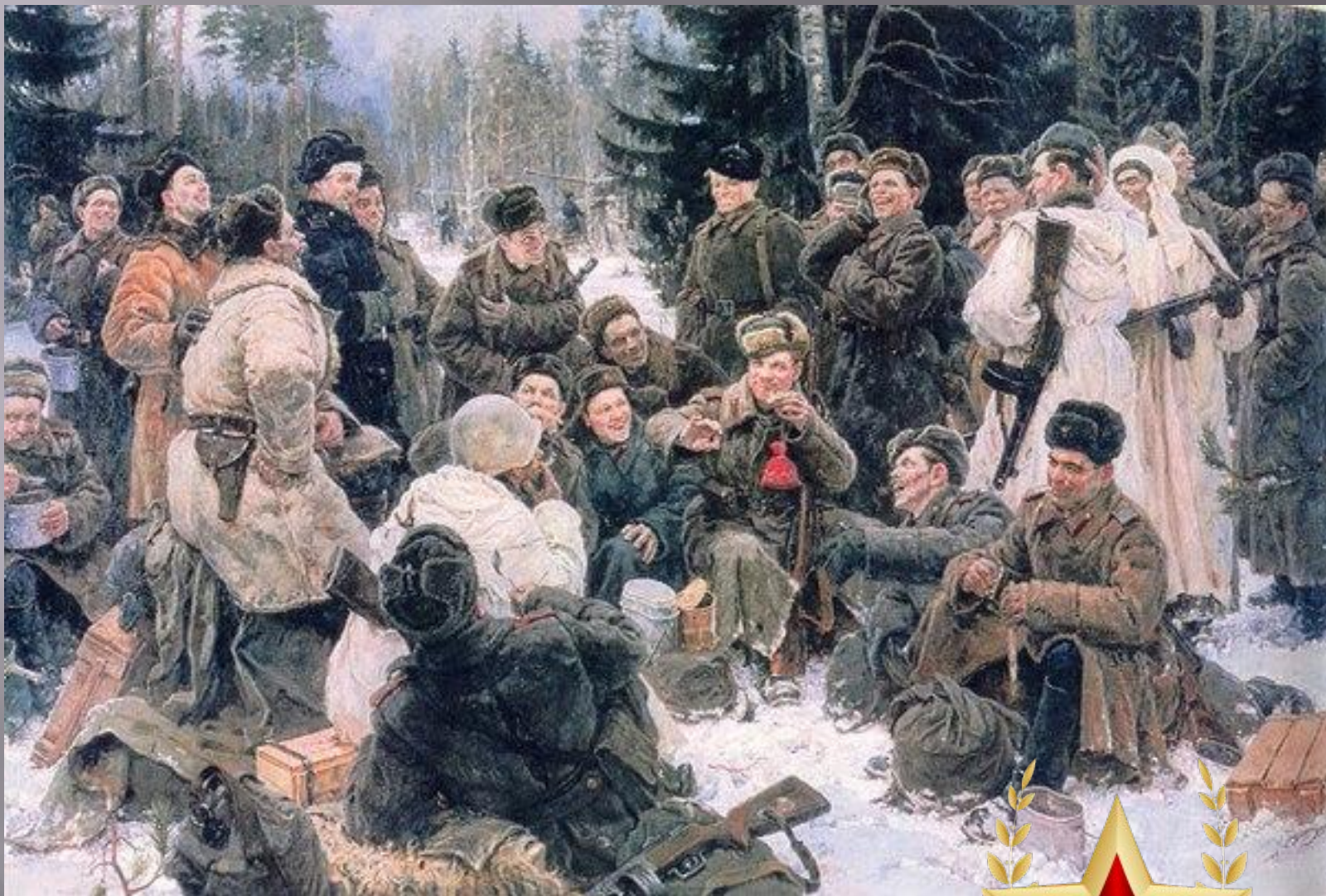
Ю. Непринцев. Отдых после боя.