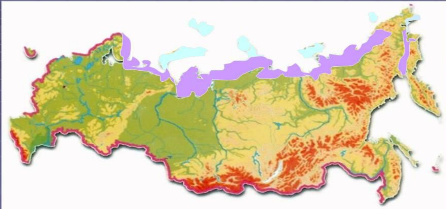
Карта России. Природные зоны.