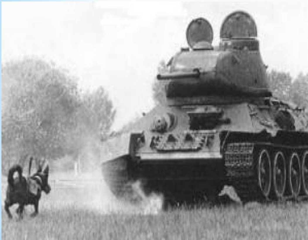
Хвостатые истребители танков

Поздняя осень 1941 года, битва под Москвой. Группа фашистских танков, пытавшихся атаковать советский рубеж, повернула назад, завидев...мчавшихся на них собак! Впрочем, испуг гитлеровцев был вполне обоснован — собаки взрывали неприятельские танки.