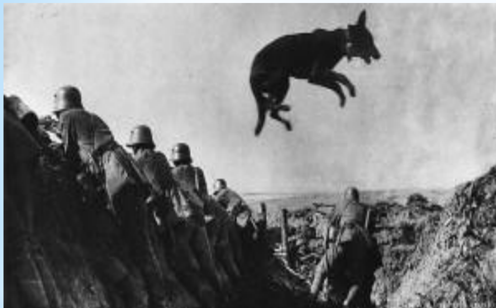
Собака - связной, несущая сообщение

На связных собак надевали специальные вьюки и они доставляли на передовую письма и газеты. Случалось, что собакам доверяли доставку орденов и медалей в подразделения, куда *невозможно было пробраться из-за сплошного обстрела.