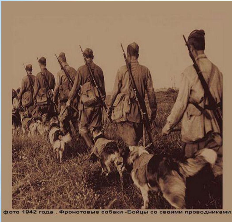
фото 1942 года . Фронтовые собаки -Бойцы со своими проводниками.

Собаки тоже сражались за Победу. Подрывали вражеские танки, ходили в разведку, обнаруживали лазутчиков, были связистами, санитарями, разыскивали фугасы и мины.