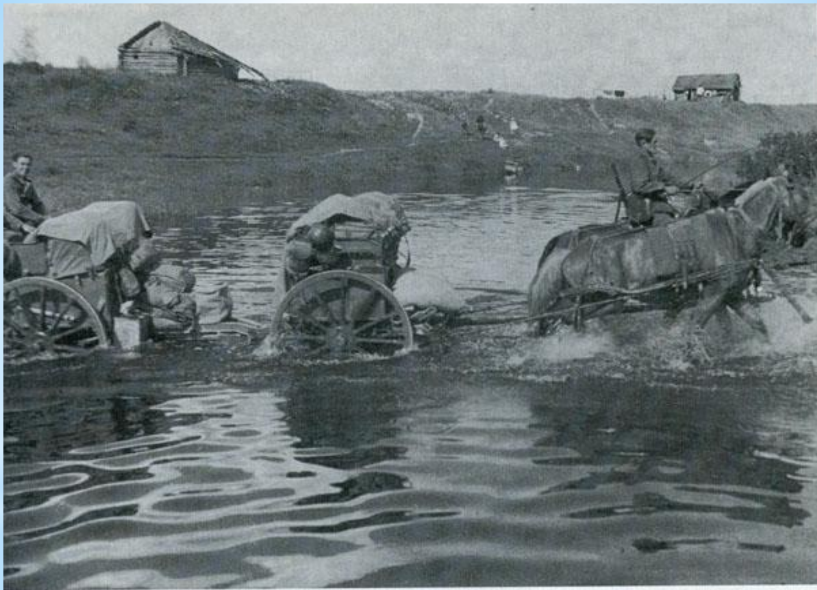
Munitions-Fahrzeug überquert den Gluschtza-Fluß-Juni 1942