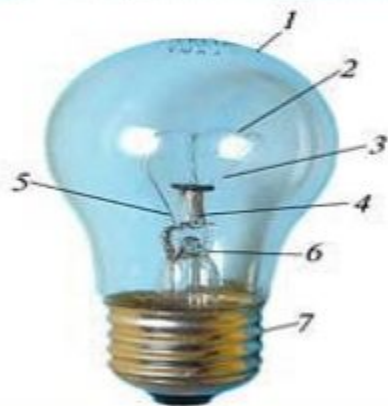
Схема электрической лампы накаливания: 1 - стеклянная колба; 2 - нить накаливания; 3 - держатели; 4 - штенгель; 5 - выводы; 6 - лопатка; 7 - цоколь.