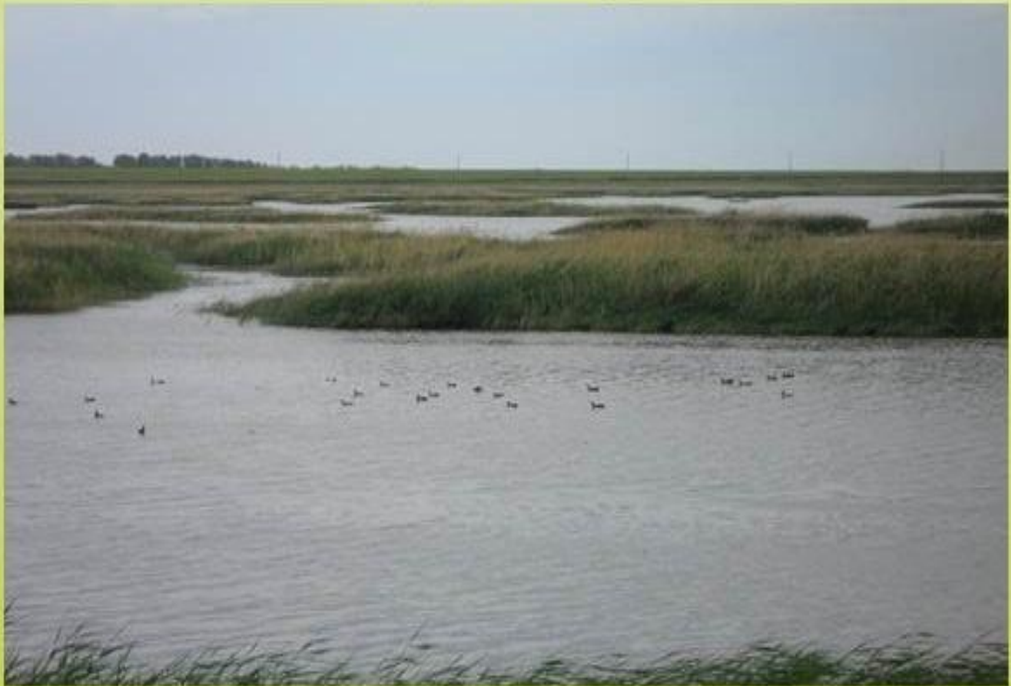
Озеро Малый Ащиккуль