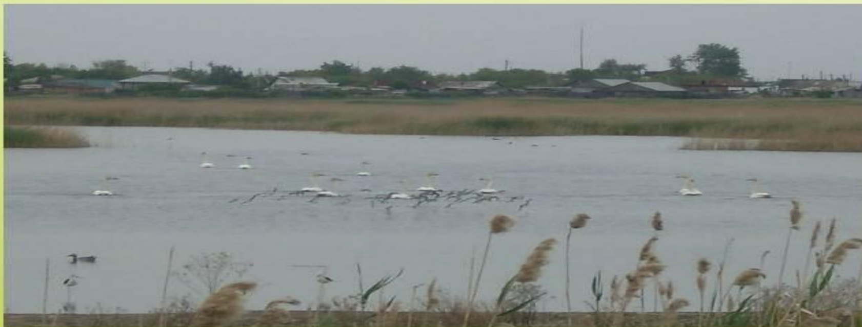
Озеро Шербакульское (Местное, Шербакты)

По одной из версий своим названием р. п. Шербакуль обязан озеру Шербакты, у которого располагается. В переводе с казахского языка Шарбак - куль означает «край озер».