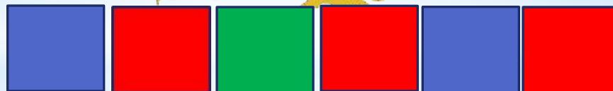
Схема слова «курица»