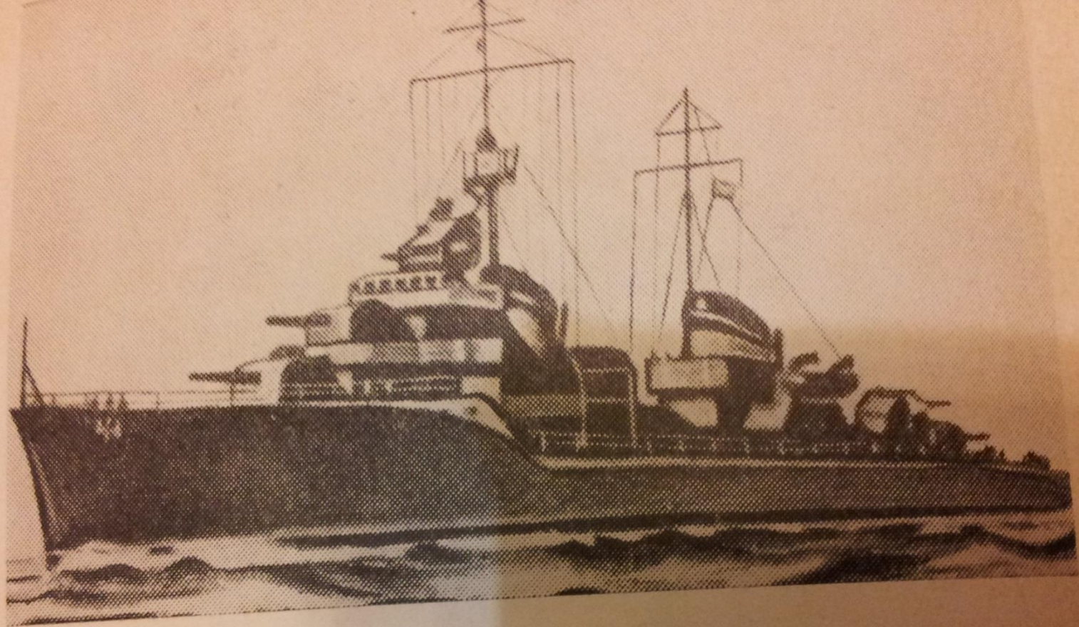
Севастополь. 1941—1942 гг. Боевые корабли: эскадронный миноносец «Бодрый», крейсер «Красный Кавказ».