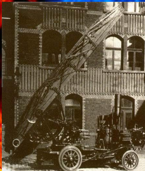
Паромобильная поворотная лестница.