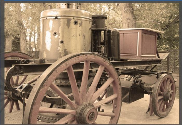
Одна из первых пожарных машин