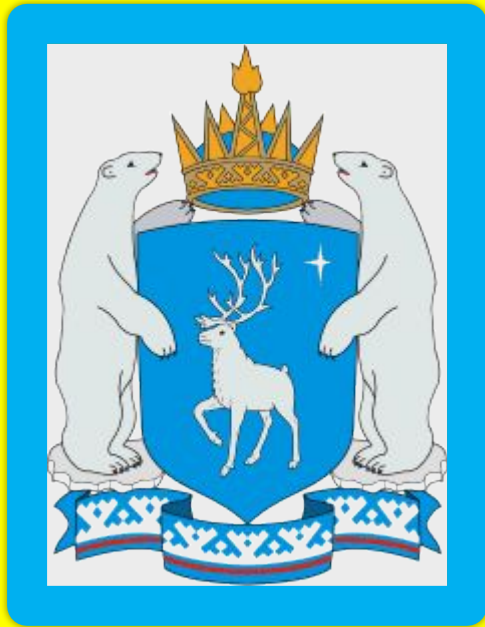
Герб Ямало-Ненецкого автономного округа