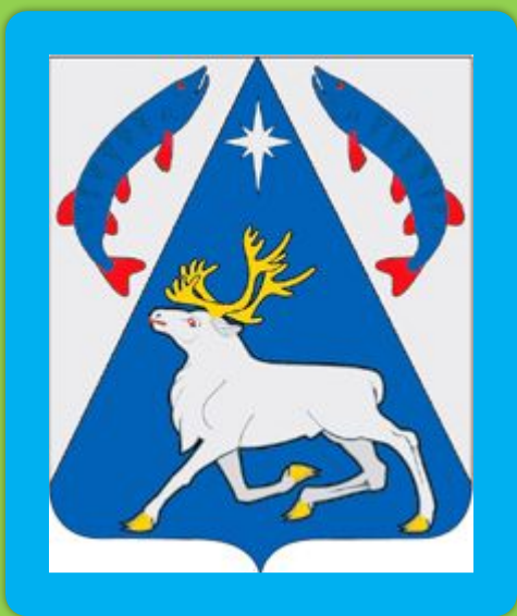
Герб села Халясавэй