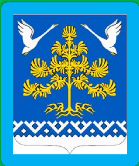
Герб деревни Харампур Пурпе