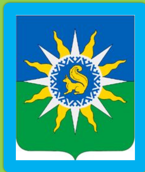
Герб поселка Ханымей