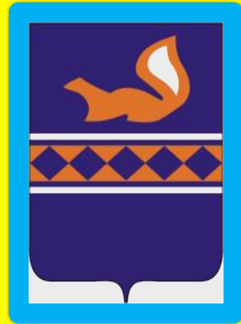
Герб Пуровского района