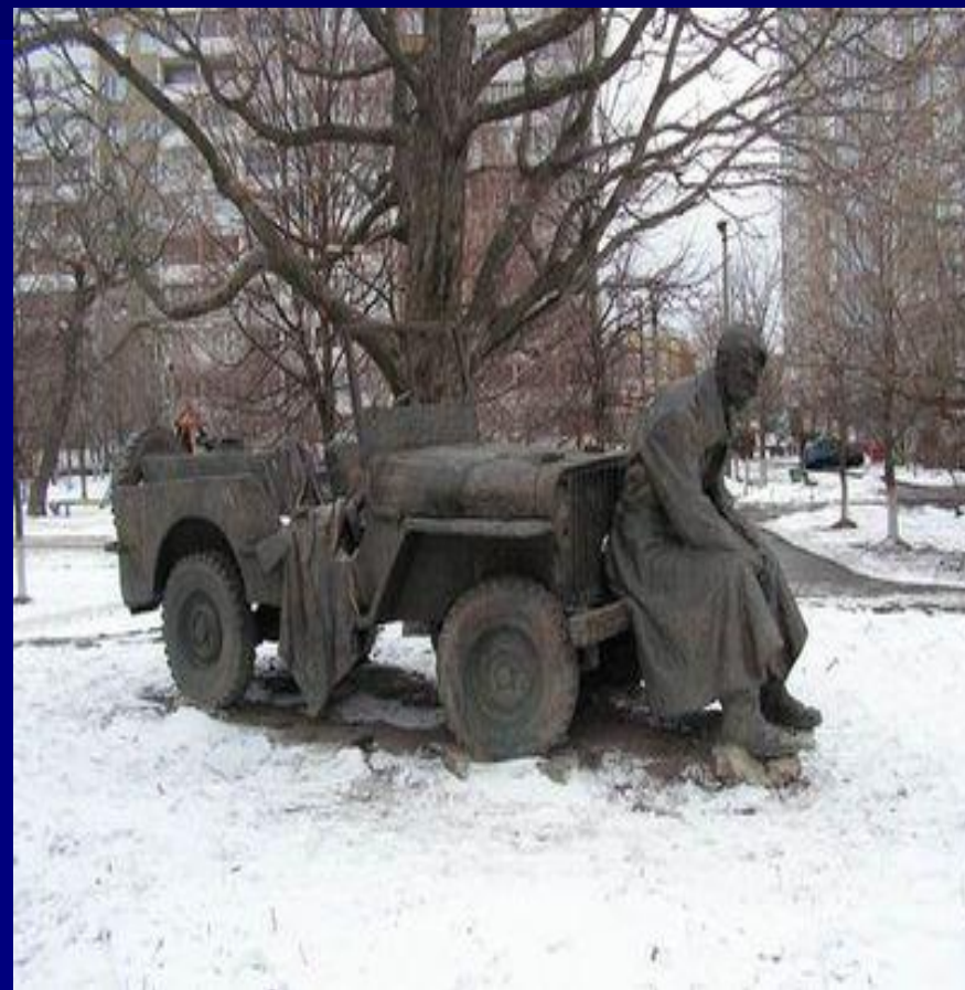
Памятник на братской могиле