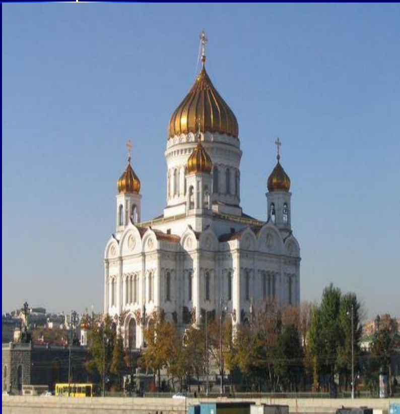
Храм Христа Спасителя