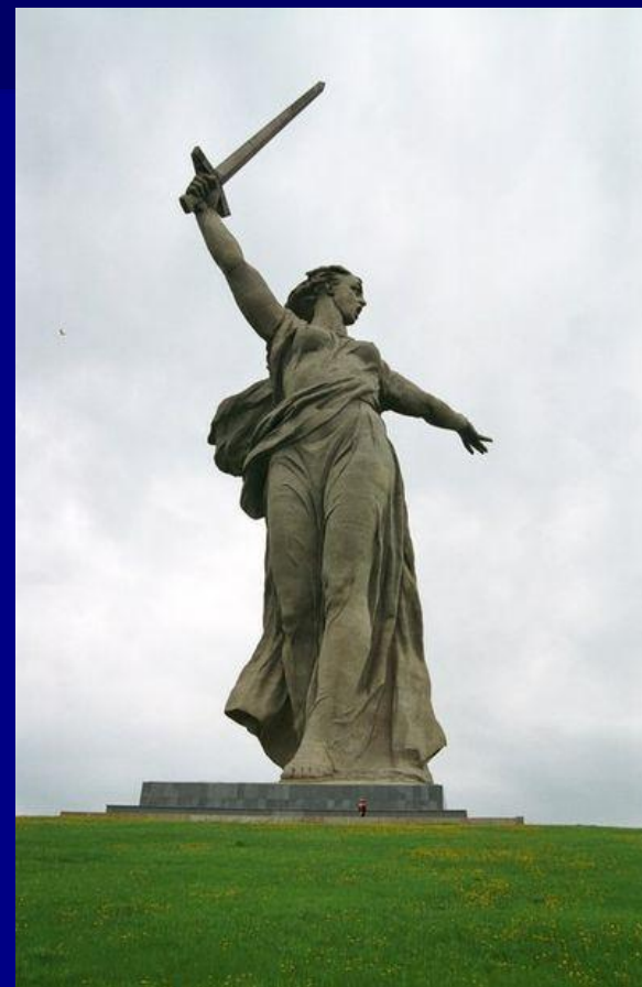
Родина – Мать