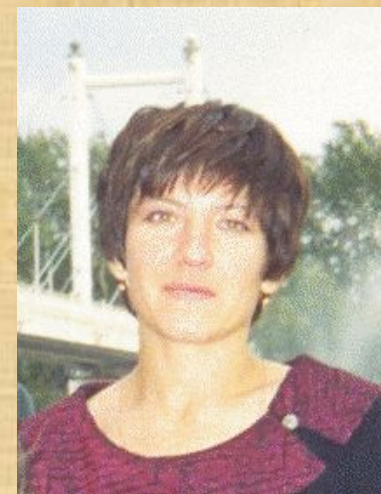
Муниципальное Наталья Владимировн а

Муниципальное общеобразовательное бюджетное учреждение «Комаровская средняя общеобразовательная школа им. В.М. Устиченко»