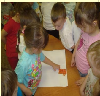
Д/и «Открой картинку»