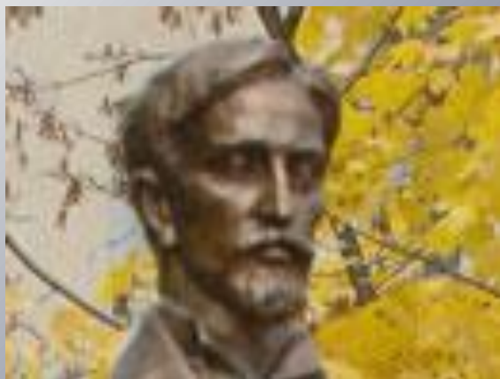
Бунин Иван Алексеевич