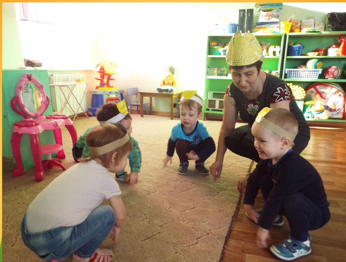
Подвижная игра «Вышла курочка гулять»