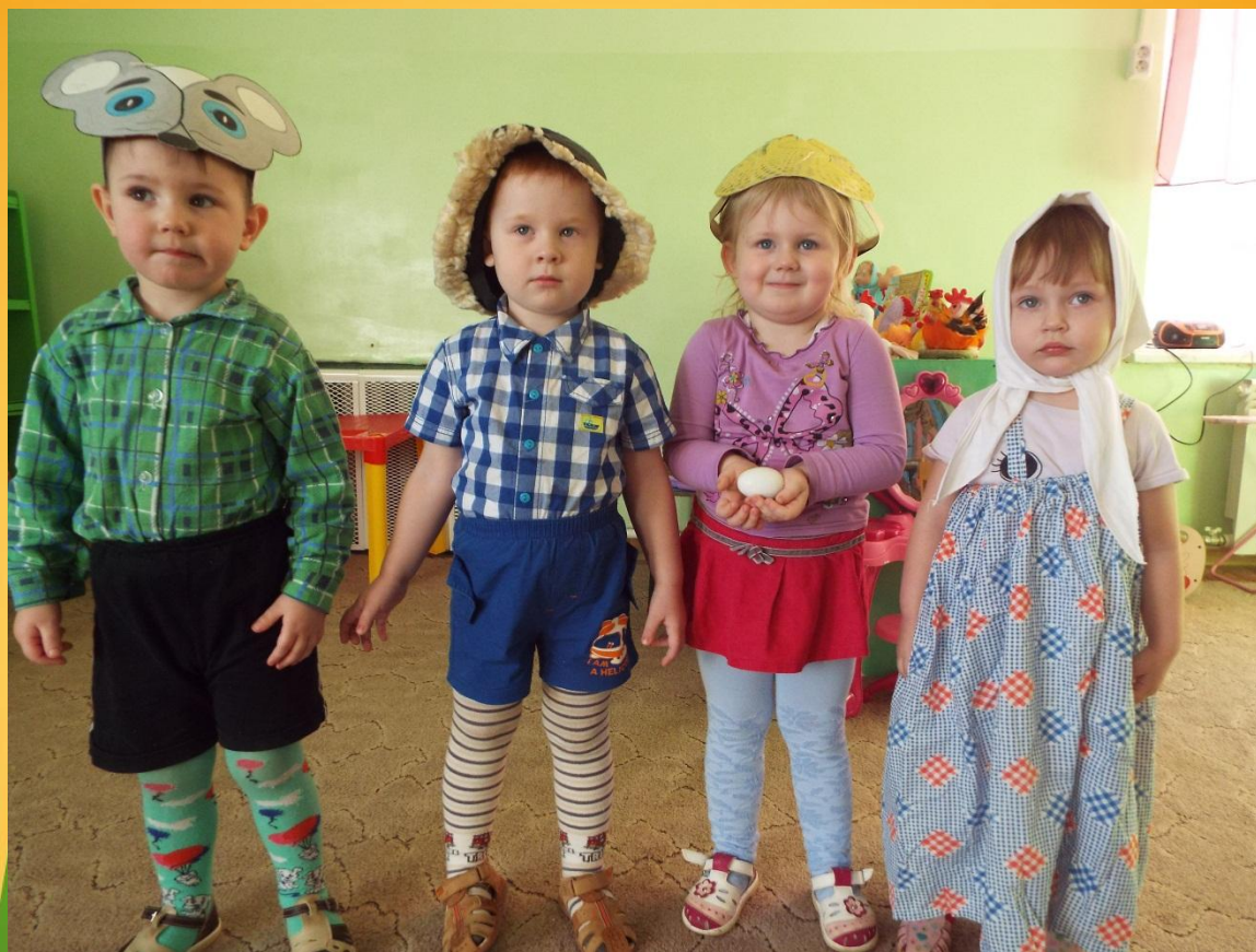
Игра-драматизация по сказке «Курочка Ряба»