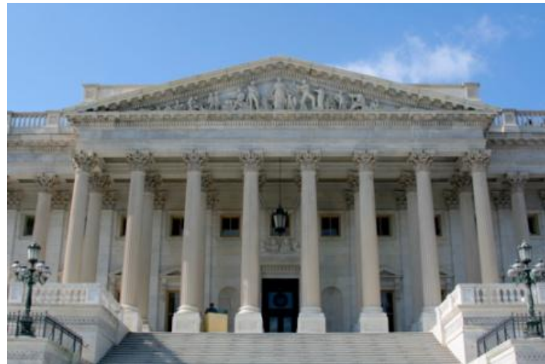
Библиотека Конгресса США