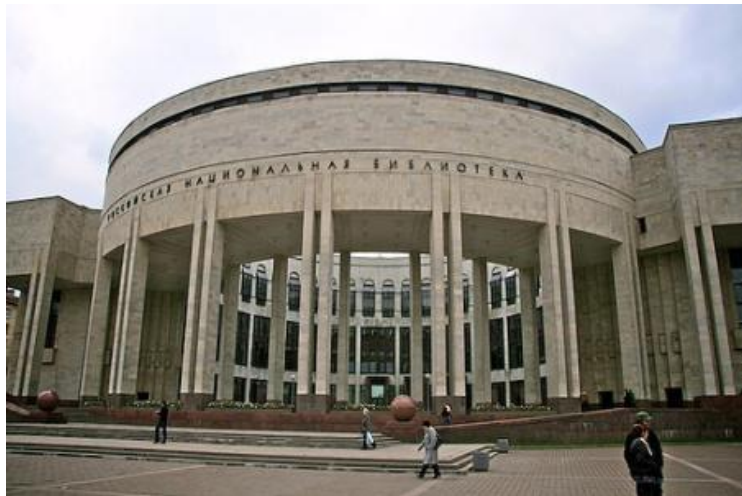
Российская национальная библиотека