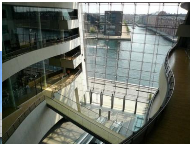
Королевская Библиотека Копенгагена