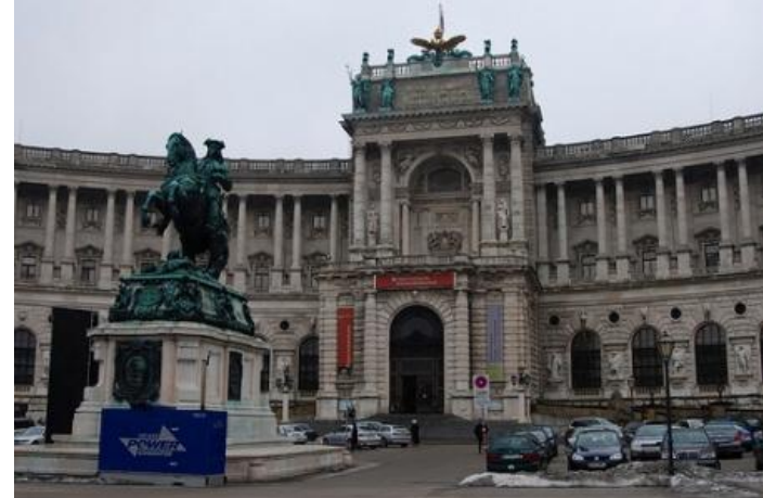
Национальная Библиотека Австрии