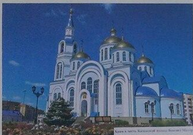
Храм в честь Святого Духа в Махачкале

Ты моя Родина, край наш, Моей Родне! В долине оврагов, любовь и карада. Мамаша и Фрог, русские братья, Мы, твои дети, слава тебе! Будь слава, край наш, и любовь, и ласка! Душой свободной и открытой душой, Ты — наша гордость, ты наша слава, Ты — наш святой, родимый край, Дружба народов тебя соединяет. Щедрость твоя и величие матерей, Дух Святого и верность отцов! Музыка твоих песен слышней, Взлетать распускается в тебе олеум, В нас возмужал и расцвел ты, Нерукотворенный Мис и Россия — Всегда мы гордимся тобой!