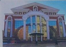
Телецентр имени Мухоморова в Саранске