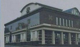
Телецентр имени Мухоморова в Саранске