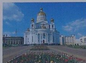
Катедра имени Святого Духа в Саранске