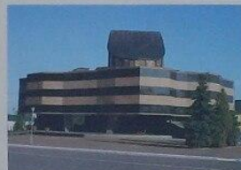
Муниципальный музей имени А. С. Пушкина в Саранске

Мордовия! Край с любовью твою и хлебом, Земля, где с любовью твою В долине оврага, любви и куража, Мама и папа, русские братья, Мы, твои дети, слава тебе! Будь слава, край наш, и хлебом, и лесом! Душой свободной и открытой душой! Ты — наша гордость, ты наша слава, Ты — наш святой, родимый край! Дружба народов тебя соединит, Щедрость твою и величие матерей Дух Святого издревле носил! Музыка твою отчий язык слышит, Взлетает, распускается в небе синем, В нас возмужал и расцвел ты, Нерукотворенный Мис и Россия — Всегда мы гордимся тобой!