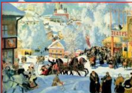
Кустодиев Борис Михайлович. «Масленица»

Этот праздник к нам идет Раннею весною, Сколько радостей несет Он всегда с собою! Ледяные горы ждут, И снежок своркает, Санки с горок вниз бегут, Смех не умолкает.