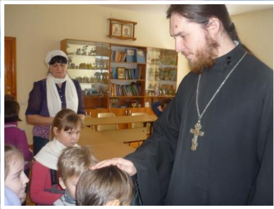
встречи со священником и педагогами воскресной школы