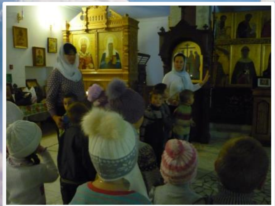
рассказы о православных праздниках