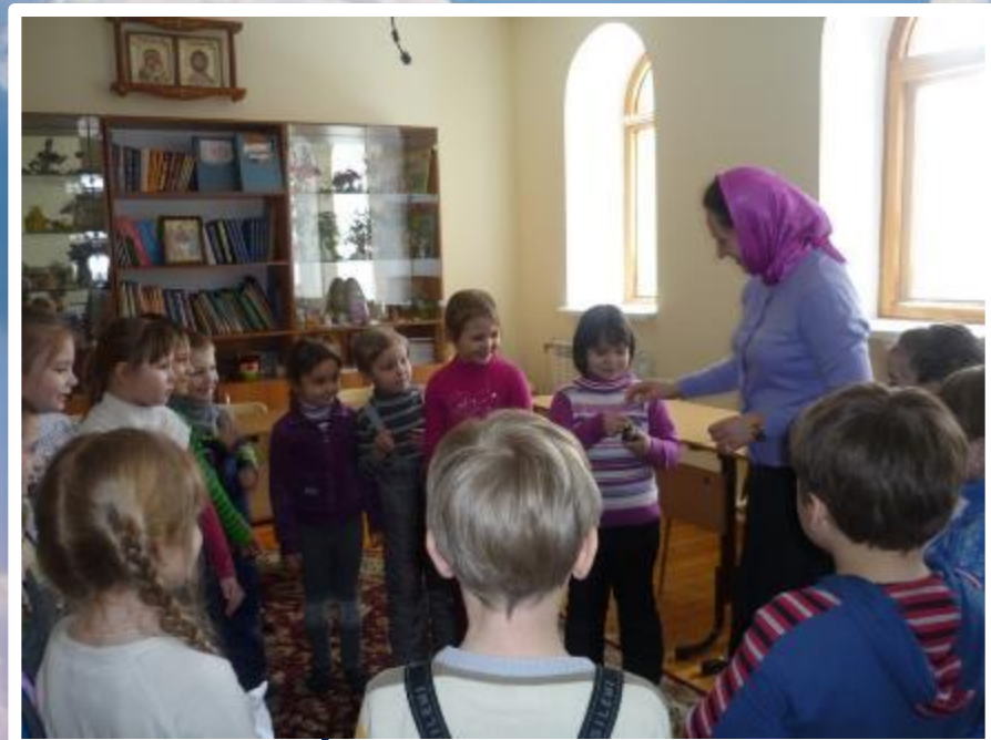
игры (дидактические, ролевые, подвижные и др.)