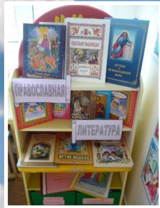
чтение художественной литературы