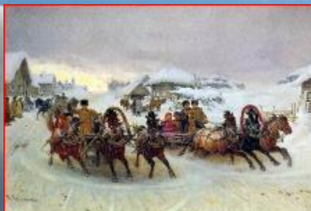
Пётр Грушинский «Масленица»

Дома аромат блинов Праздничный чудесный, На блины друзей зовем, Будем есть их вместе. Шумно, весело пройдет Сырная Седлица, Будем вместо песни петь Плясать и веселиться.