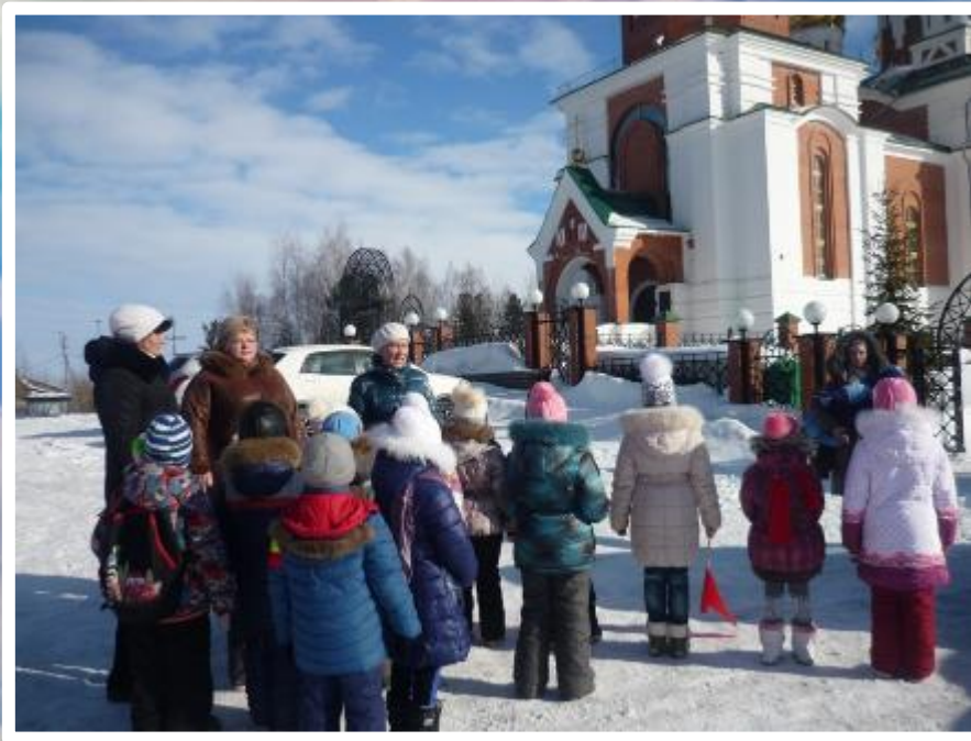
экскурсии и целевые прогулки