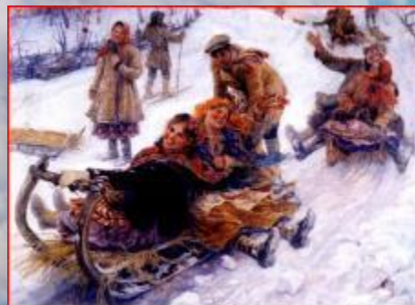
Федот Васильевич Сычков «Катание на масленицу»

Как на масленой неделе Из печи блины летели! С пылу, с жару, из печи, Все румяны, горячи! Масленица, угощай! Всем блинчиков подавай. С пылу, с жару - разбирайте! Похвалить не забывайте.