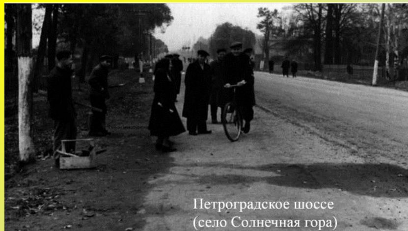
Петроградское шоссе (село Солнечная гора)

Сегодня через город проходят две важнейшие магистралы – шоссе и железная дорога Москва- Санкт-Петербург