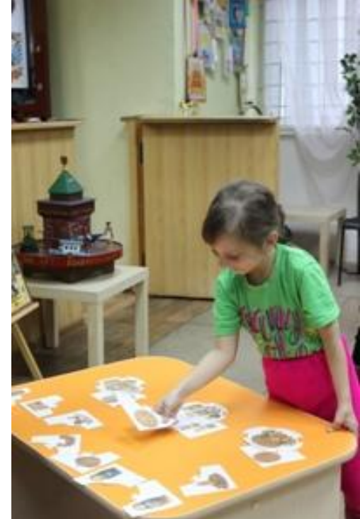
Дидактическая игра «Собери роспись»