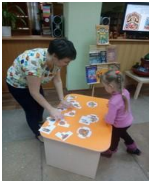
Дидактическая игра «Разложи росписи»