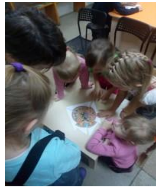
Дидактическая игра «Разрезные картинки»