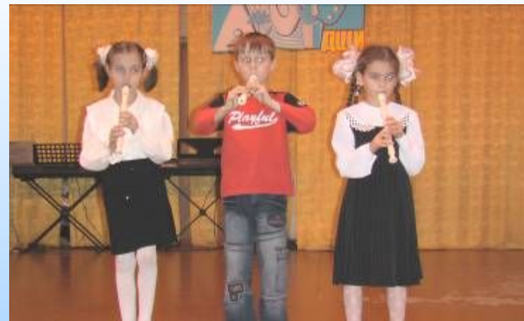
Академические концерты – концерты класса