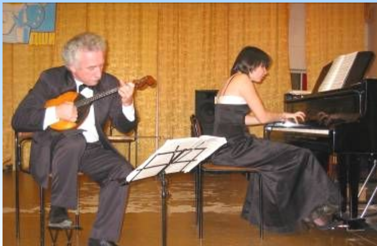
Встречи с профессиональными музыкальными коллективами