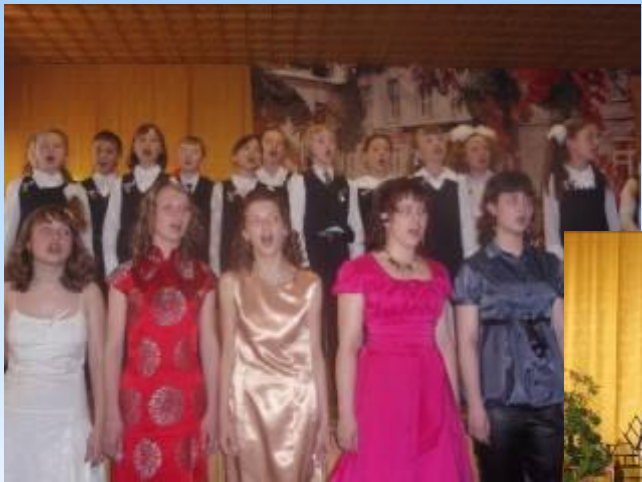
песня школьного звонка