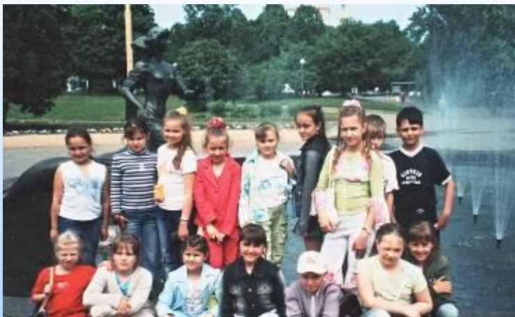
Туристические поездки на музыкальные концерты, спектакли