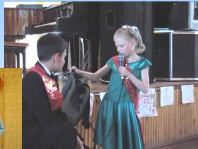
в одном счастливом детстве