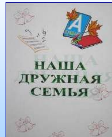
СИСТЕМА ИННОВАЦИОННОЙ ОЦЕНКИ «ПОРТФОЛИО»