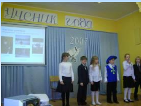
КОНКУРС «УЧЕНИК ГОДА»