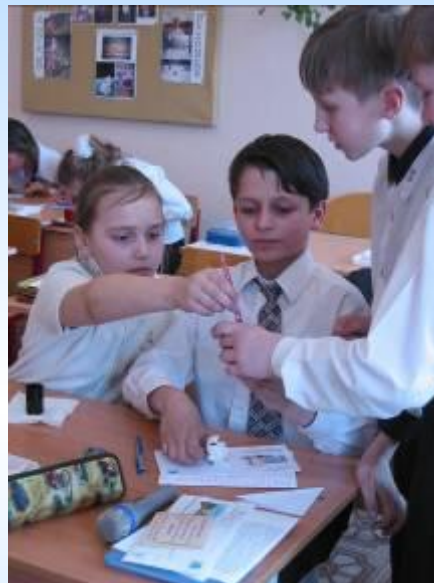
ТЕХНОЛОГИЯ РАЗВИТИЯ ИССЛЕДОВАТЕЛЬСКИХ НАВЫКОВ