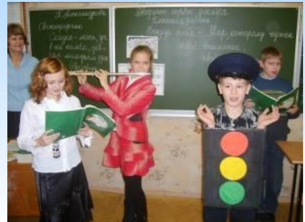
ТЕХНОЛОГИЯ ИГРОВОГО ОБУЧЕНИЯ