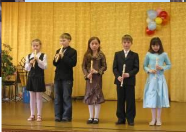
ПРАЗДНИКИ ДОБРА И КРАСОТЫ, МУЗЫКИ И ТВОРЧЕСТВА