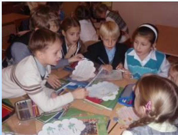
ТЕХНОЛОГИЯ ПРОБЛЕМНО- ДИАЛОГИЧЕСКОГО ОБУЧЕНИЯ