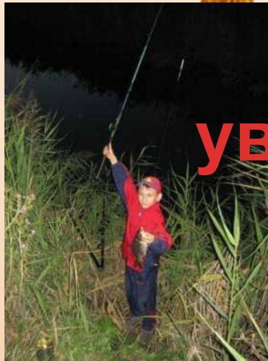
Рыбачить с папой