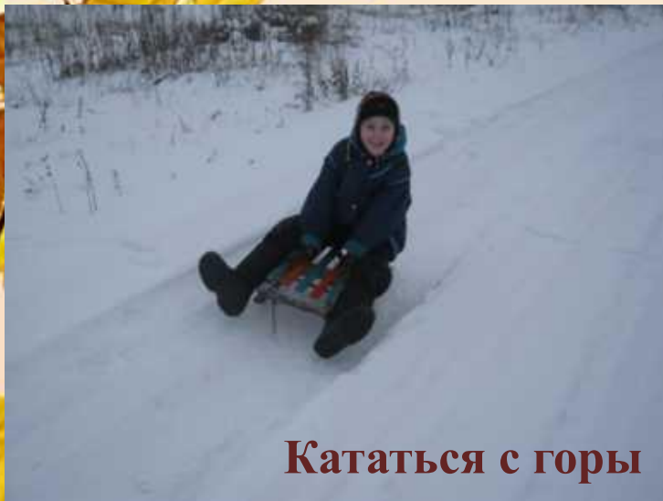
Кататься с горы