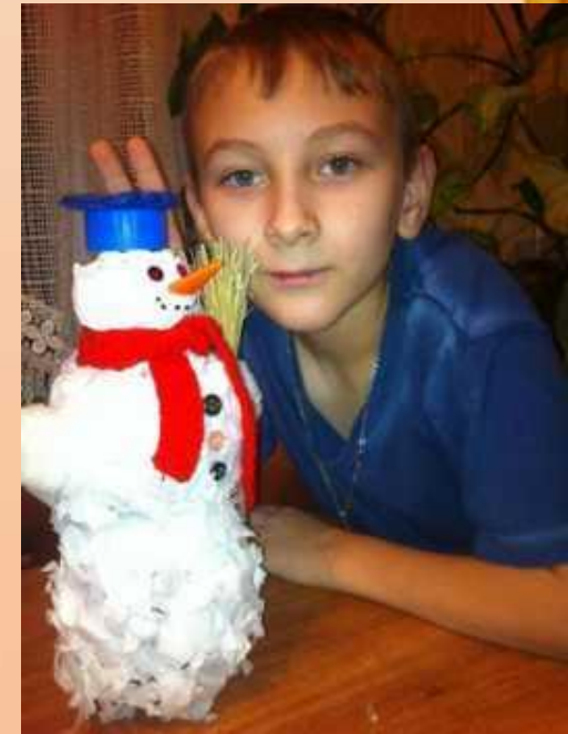
Мастерить с сестрой