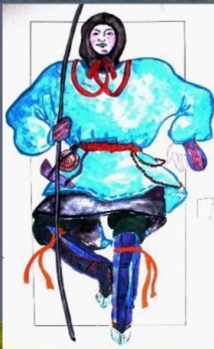
Костюм ижемского оленевода

В мужской одежде выделяют костюм оленевода, костюм крестьянина, костюм