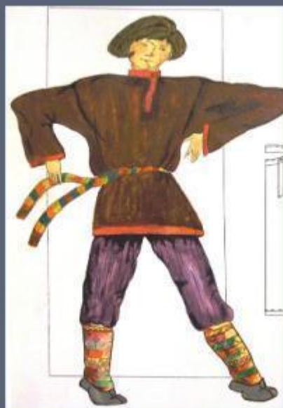
Костюм крестьянина Усть-Сысольского уезда