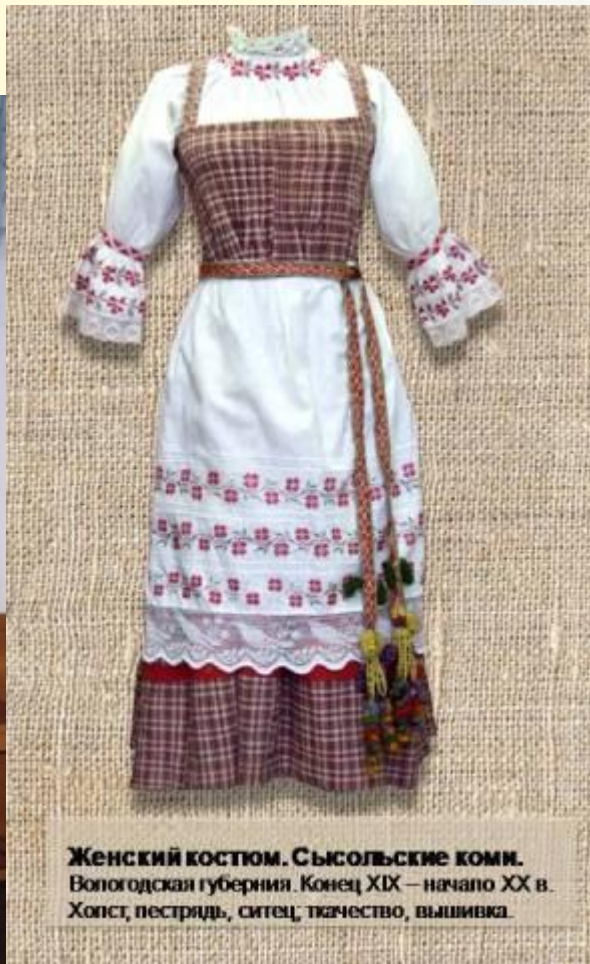
Женский костюм. Сясьольские коми. Вологодская губерния. Конец XIX – начало XX в. Холст, пестрица, ситец, ткачество, вышивка.