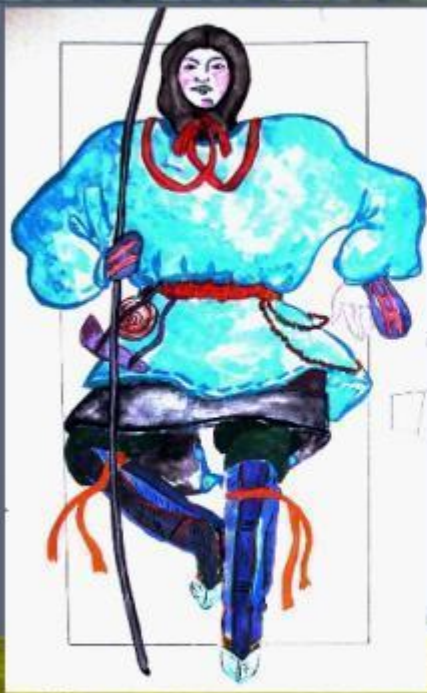
Костюм ижемского оленевода

В мужской одежде выделяют костюм оленевода, костюм крестьянина, костюм