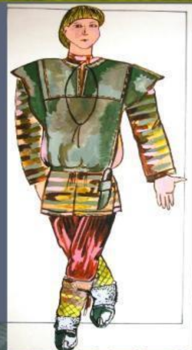
Костюм охотника из Удрского района