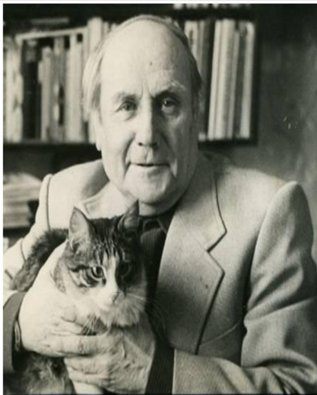
В.Г. СУТЕЕВ – ПИСАТЕЛЬ И МУЛЬТИПЛИКАТОР