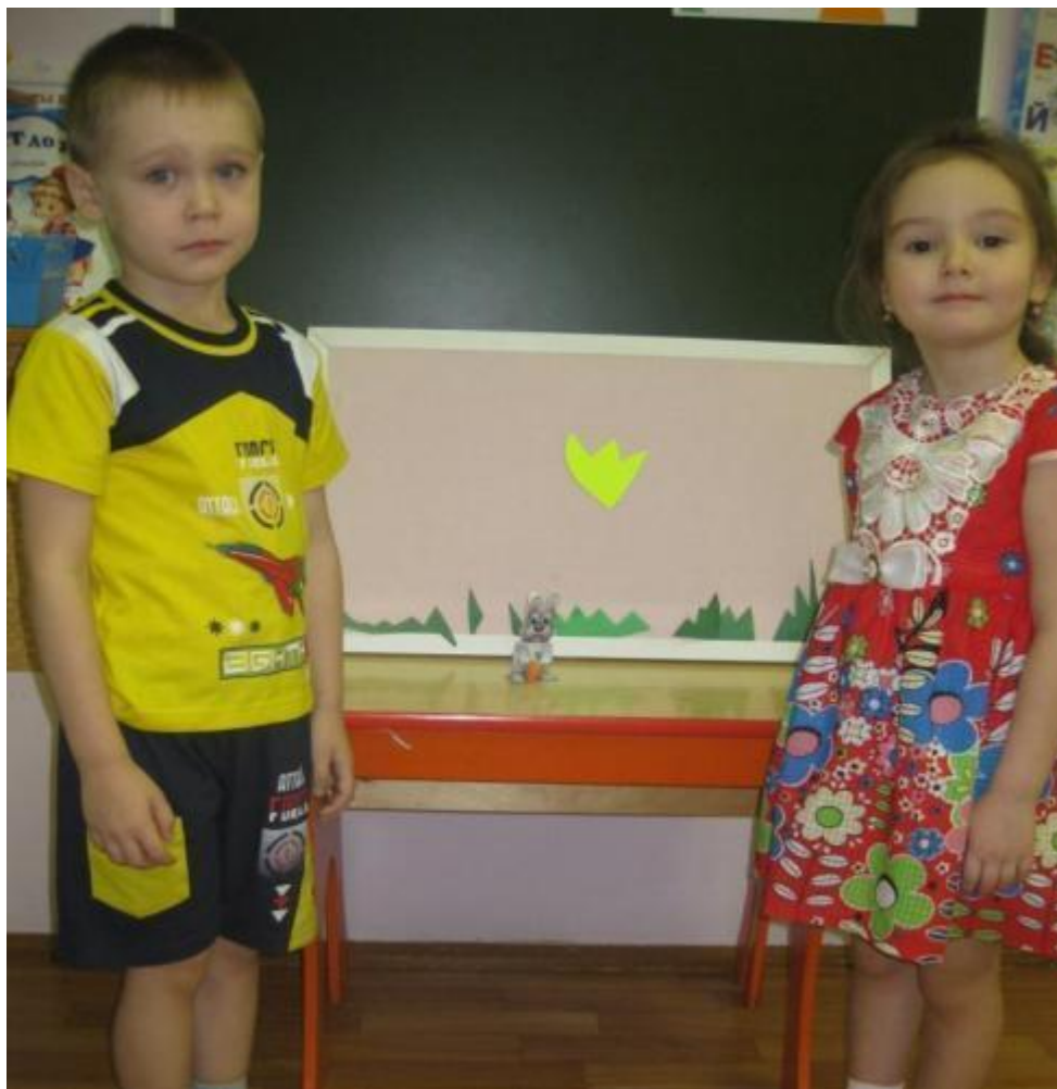
Театр на фланелеграфе по сказке «Зайчик» (Мансийская)