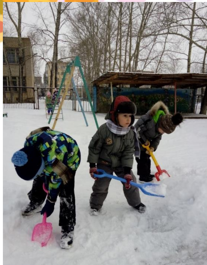
Помогали дворнику расчистить дорожку