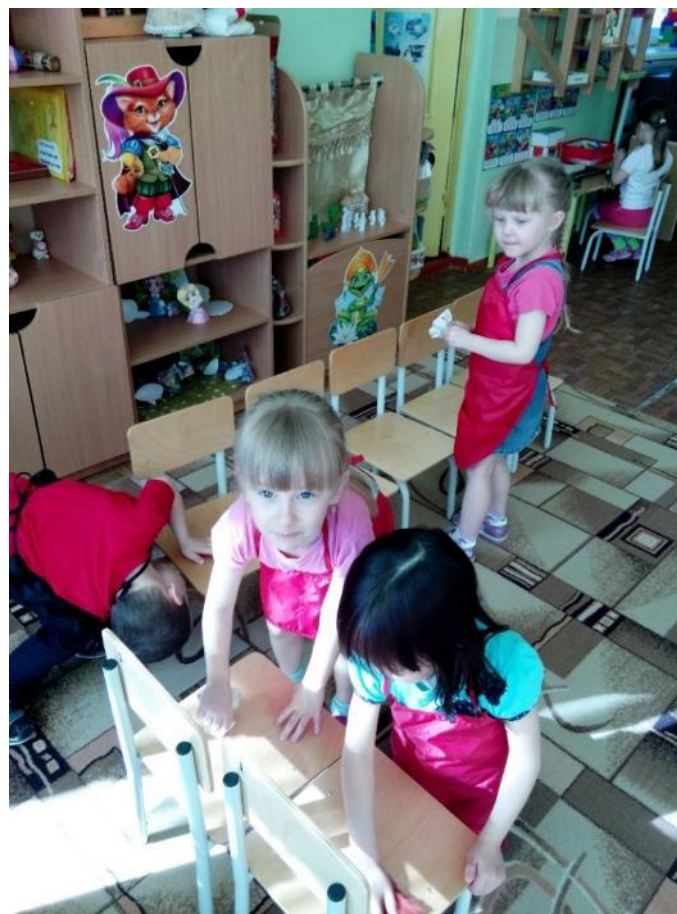
Помогали няне мыть стульчики