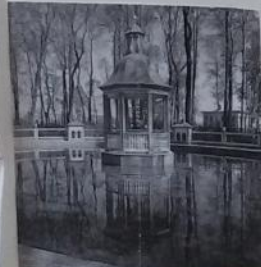
Птичий или Лебяжий

Скульпры и все раскопки и труды, которые выполняются в Летнем саду. Задача его Петра I, исполнить и разработать чертежи. Через год, в 1719 году был создан парк. В этом саду создали множество оград, улиц и аллей. Построили в саду его стали называть Птичий и Лебяжий. Обозначили его деревянными оградками, аллеями и площадками. В центре для танца.