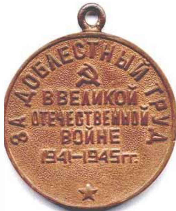
МЕДАЛЬ ЗА ДОБЛЕСТНЫЙ ТРУД