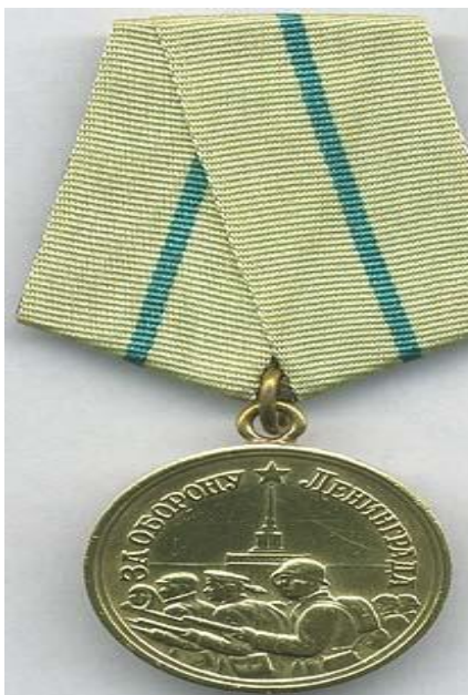
МЕДАЛЬ ЗА ОБОРОНУ ЛЕНИНГРАДА