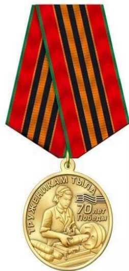
МЕДАЛЬ ТРУЖЕНИК ТЫЛА