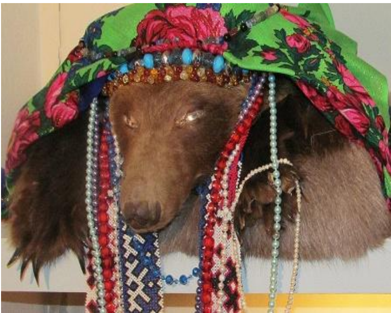
Медвежий праздник – самый любимый праздник хантов и манси.

В праздник Вороний день – на деревьях завязывают кусочки ткани