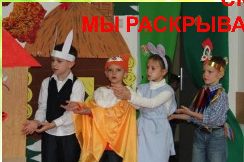
Лучше сказок в мире нет,