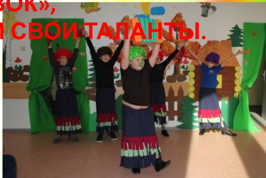
Это скажет каждый.