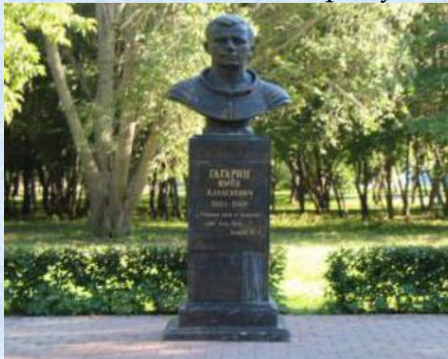
Памятник Ю. А. Гагарину