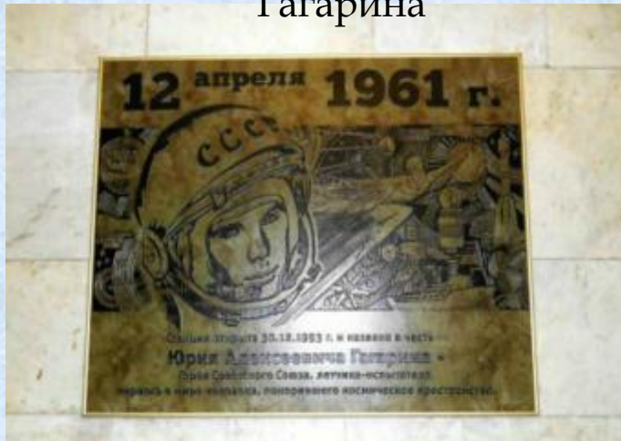
Памятник Ю. А. Гагарину