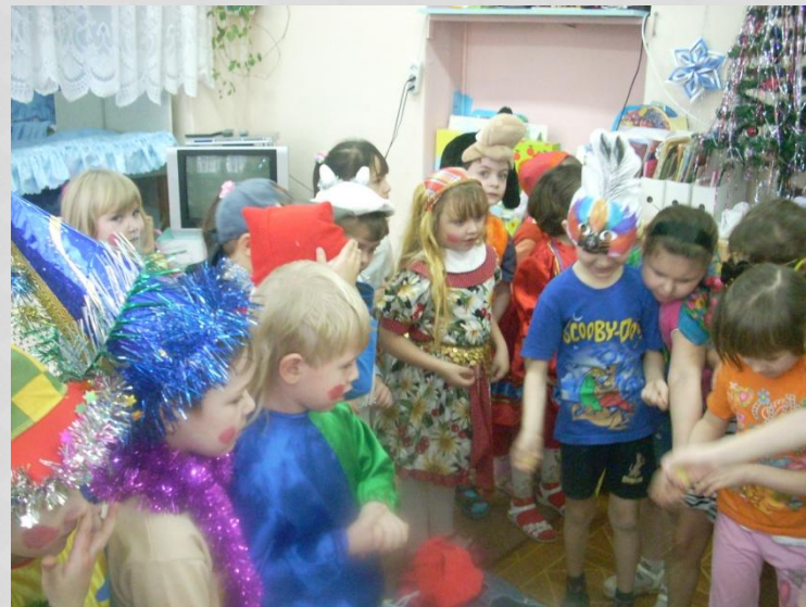
Колядки в детском саду