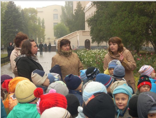
Экскурсия по городу