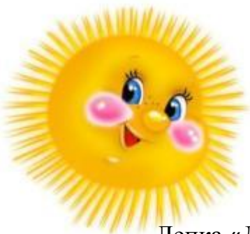
Лепка «Дома бывают разные»