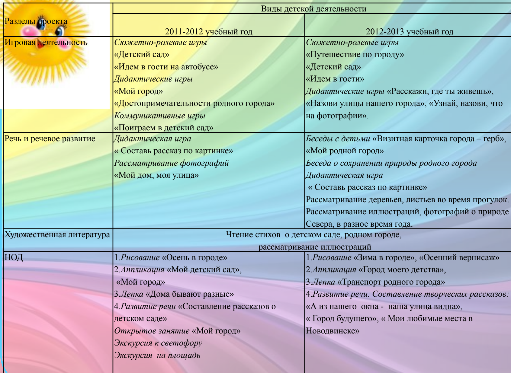
Схема реализации проекта через разные виды деятельности