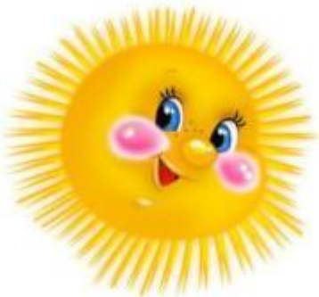
Аппликация «Мой детский сад»