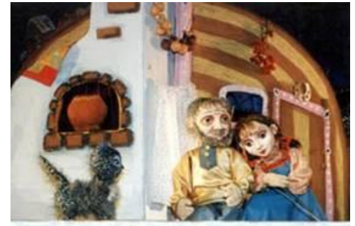
Спектакль Омского кукольного театра «Серебряное копытце»