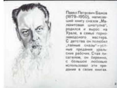
Павел Петрович Бажов (1879–1950), написавший книгу сказов «Малахитовая шкатулка», родился и вырос на Урале, в семье горнозаводского мастера. С детства он полюбил «таинные сказы» – устные предания уральских рабочих. Став писателем, он бережно, с большой любовью использовал эти предания в своих книгах.