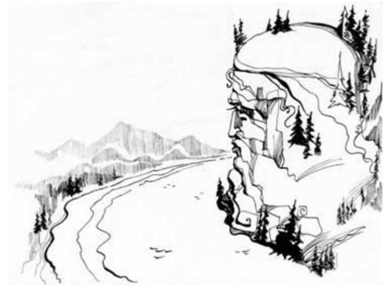
«Сказы Бажова. Старик-камень». Художники Патокины

В 1943 г. уральскому сказочнику присвоено звание лауреата Сталинской премии II степени, а в 1944 г. за плодотворную творческую деятельность он награждён орденом Ленина – первым и единственным из числа уральских писателей.