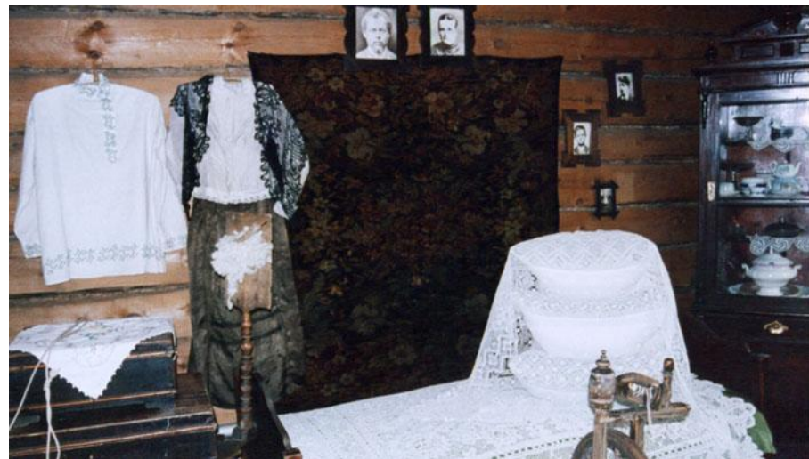
Комната в доме Бажовых, Сысерть