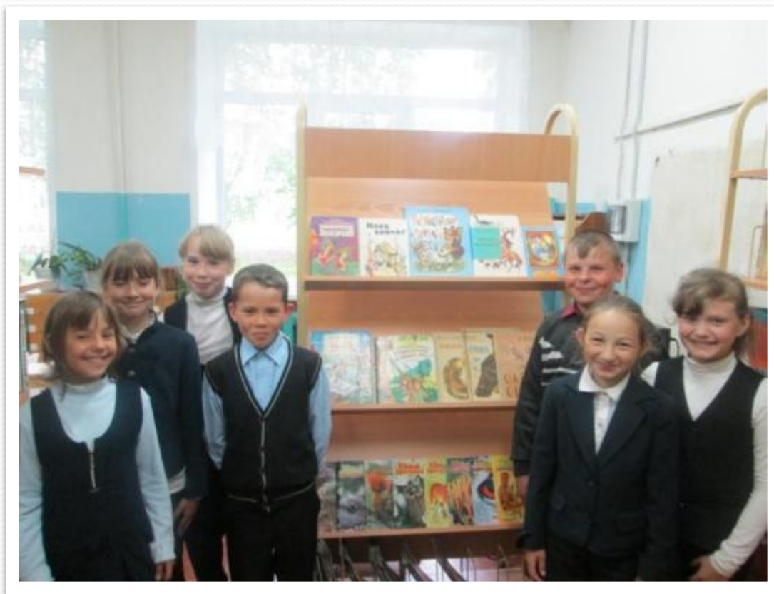
Выставка книг в школьной библиотеке