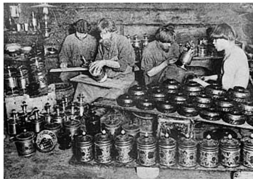
Окрашивание деревянной посуды

В числе промысловых занятий было кружевное производство, изготовление корзин и плетёной мебели, производство посуды, сбор ягод, грибов и т.д. Подростки принимали активное участие в коллективных, включавших несколько семей, выездах на промысел. В ходе них они знакомились с природой, учились лучше ориентироваться на местности, перенимали опыт сооружения промысловых становищ. К 14-15 годам основные промысловые, навыки были переняты. Отправлявшийся весной на промысел отец не боялся оставить сына этого возраста промышлять в лесу одного.