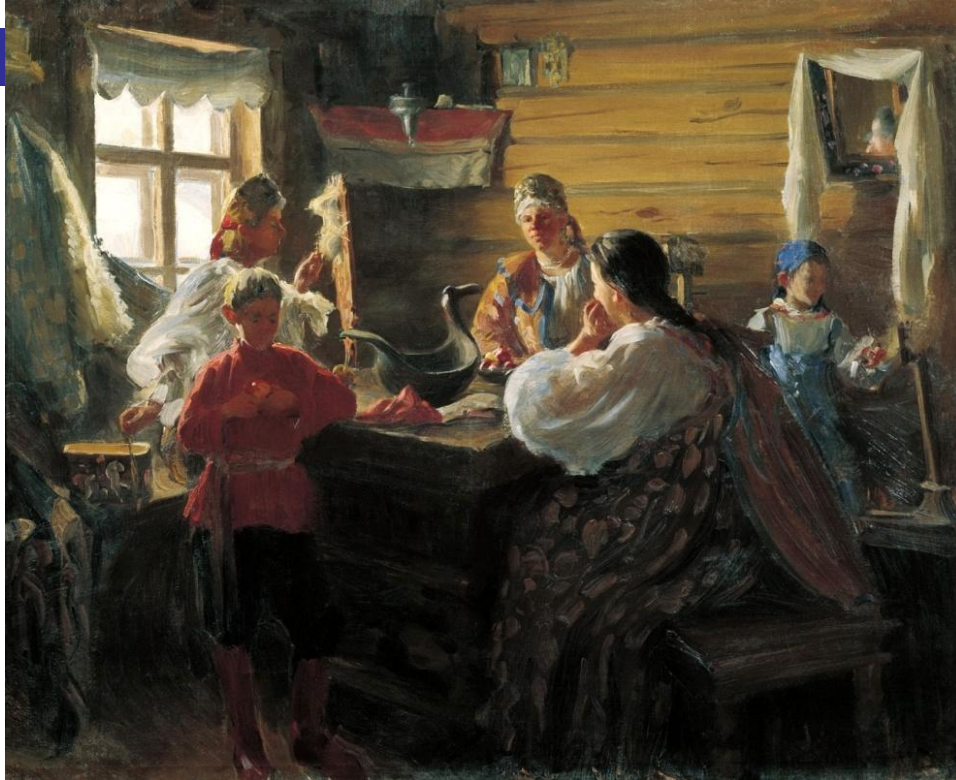
Художник И.С. Куликов

■ Делами по дому распоряжалась старшая женщина в семье – “большуха”, жена главы семьи. Она, как правило, ведала семейными запасами, хранила общесемейные деньги, следила за порядком в доме, распределяла работы среди женщин. Большуха во всем была советницей мужу, а в домашних делах обладала определенным первенством, с которым считались все мужчины. В случае длительной отлучки мужа, например при его уходе на заработки, она брала на себя руководство всем хозяйством, включая полевые работы.