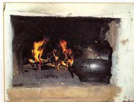
Живой огонь печи

Горница отапливалась изразцовой печью, наподобие голландской.