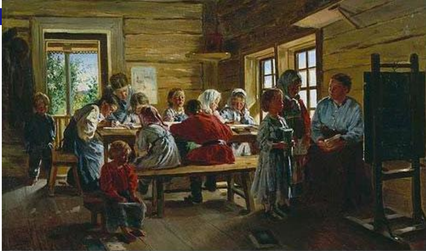
Владимир Егорович Маковский “В сельской школе”, 1883 год