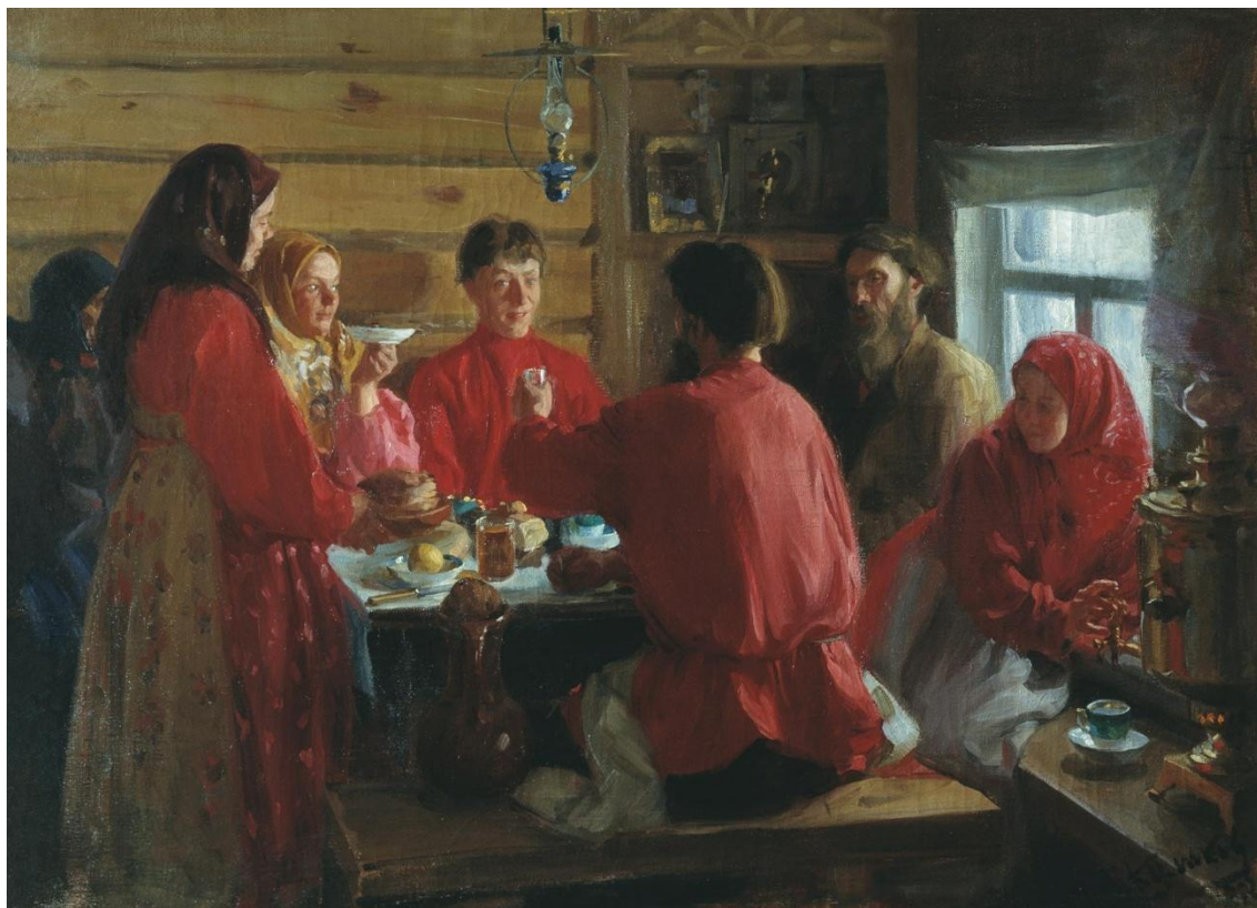
Художник И.С. Куликов