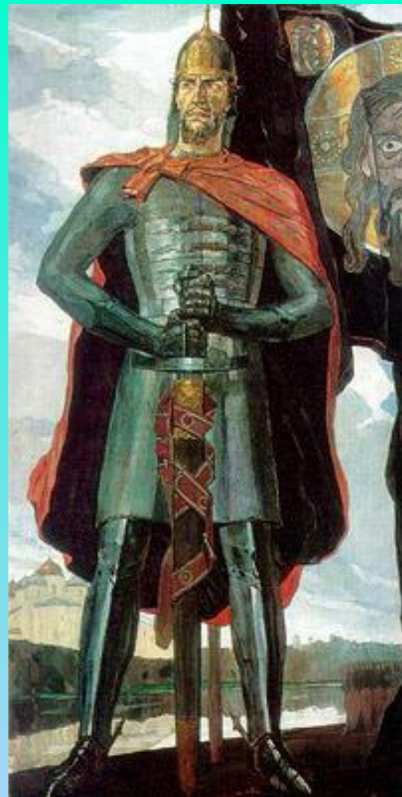
П. Д. Корин Александр Невский. (1942).