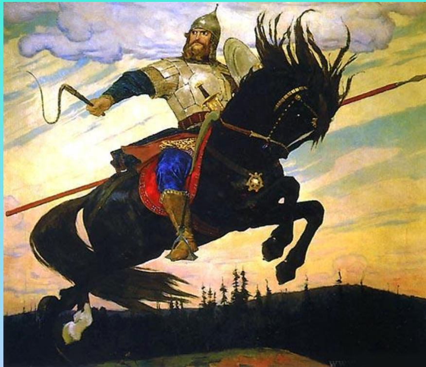
В. М. Васнецов. Богатырский скак. 1914

Крепкое телосложение, строгое лицо, длинные волосы, усы, борода.