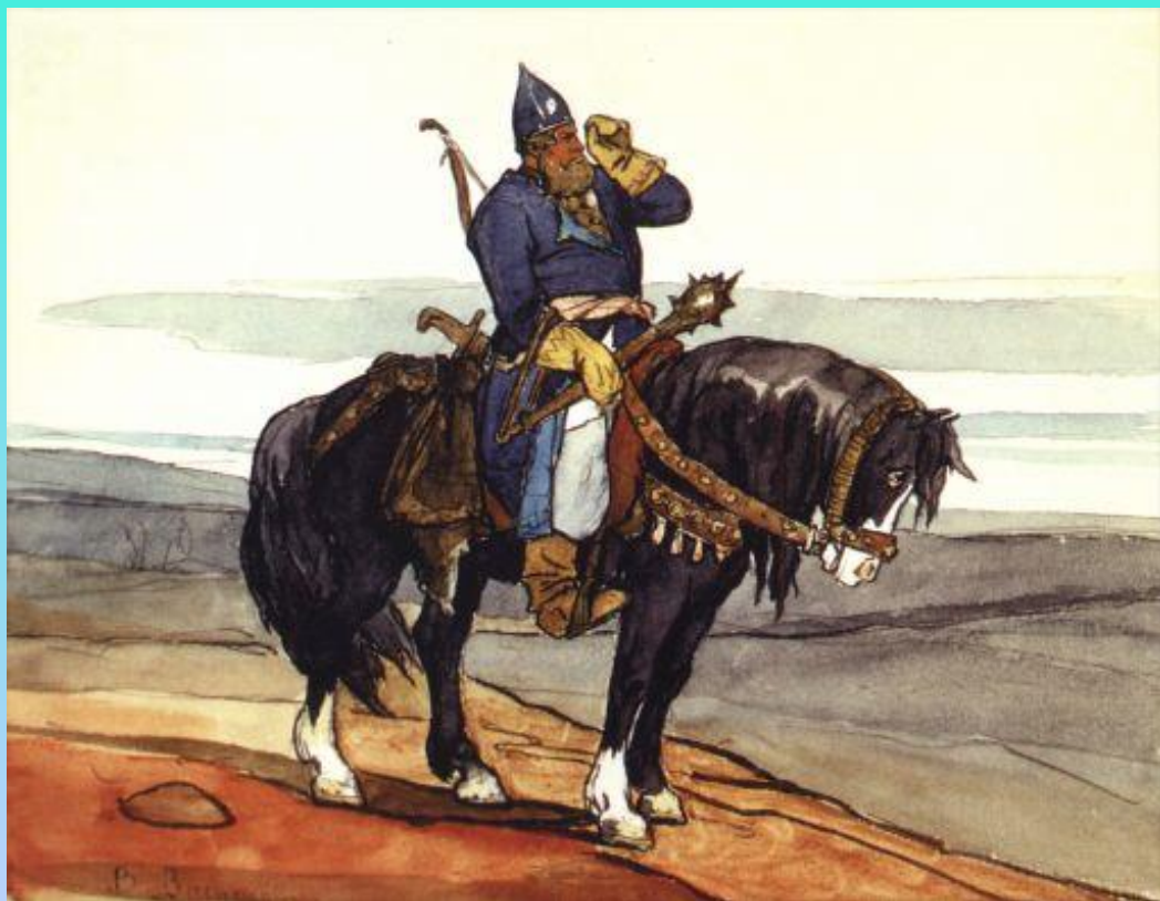
М.В. Васнецов. Богатырь (1870).