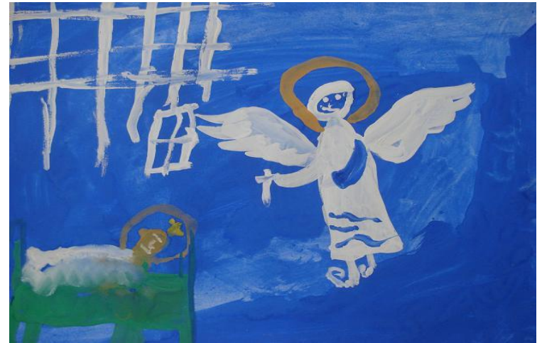
Горбачев Р. «Иоанн и ангел»