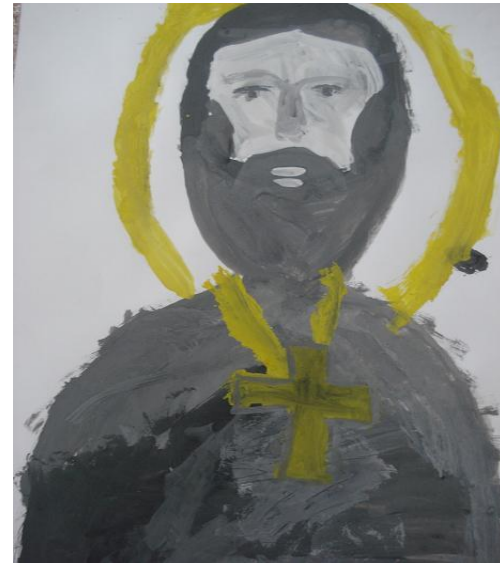
Иванов Н. «Святой И. Кронштадтский»