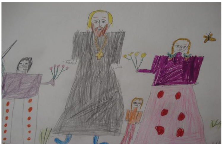
Коптелова М. «Пастырь и дети»