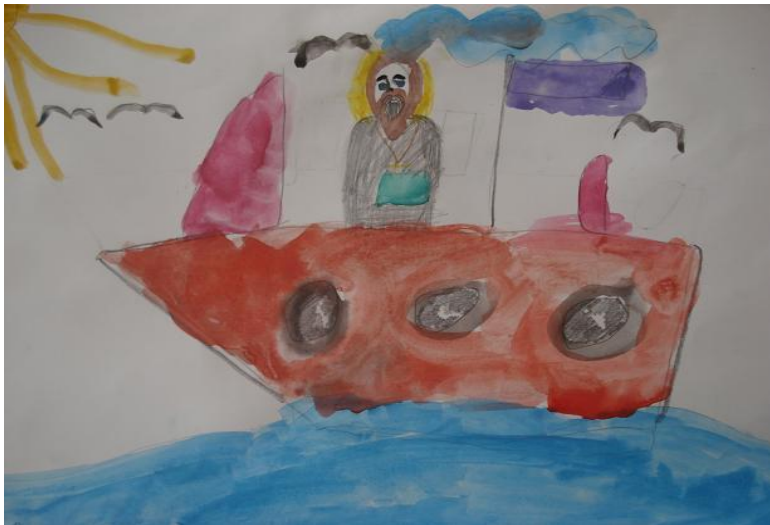
Коптелова М. «В Суру на кораблике»