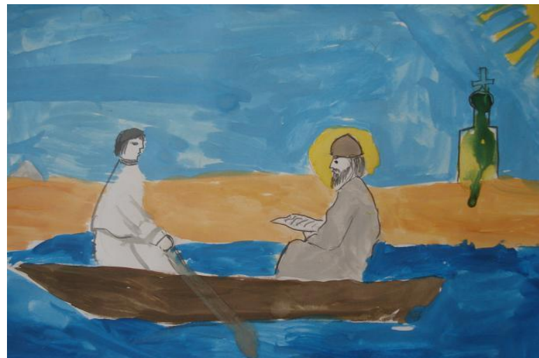
Добровольская Е. «Духовные беседы»