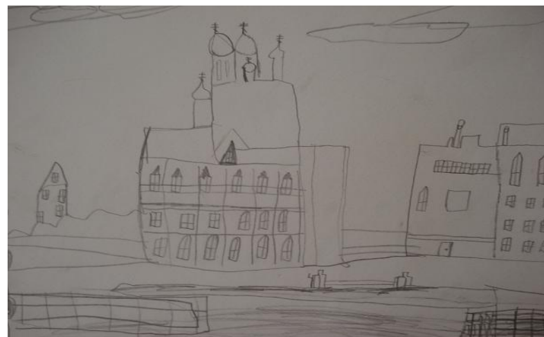
Иванов Н. А. «Иоанновский монастырь»