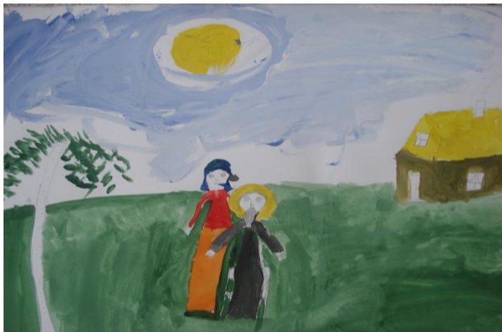
Васильева М. «Отец Иоанн и мама»

18 февраля мы ездили с классом в гости к Иоанну Кронштадтскому в г. Кронштадт.