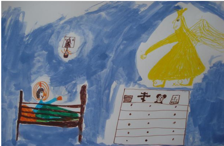
Мишакин Е. «Научи меня молиться!»