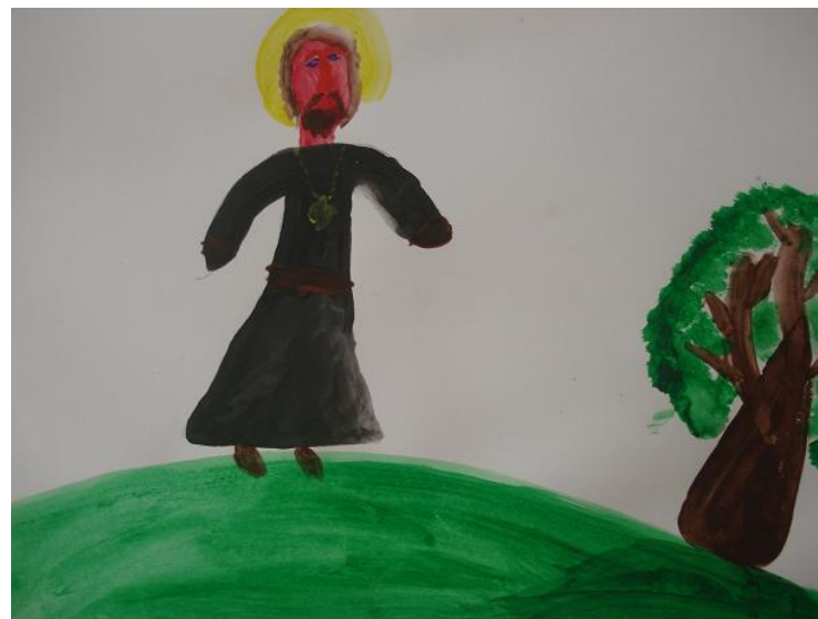
Павлов К. «На прогулке»