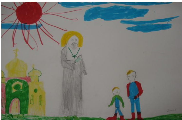
Сафронов Д. «Благословение детей»