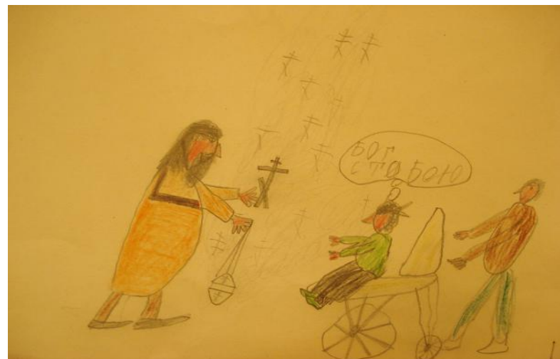
Мишакин Е. «Бог с тобою»