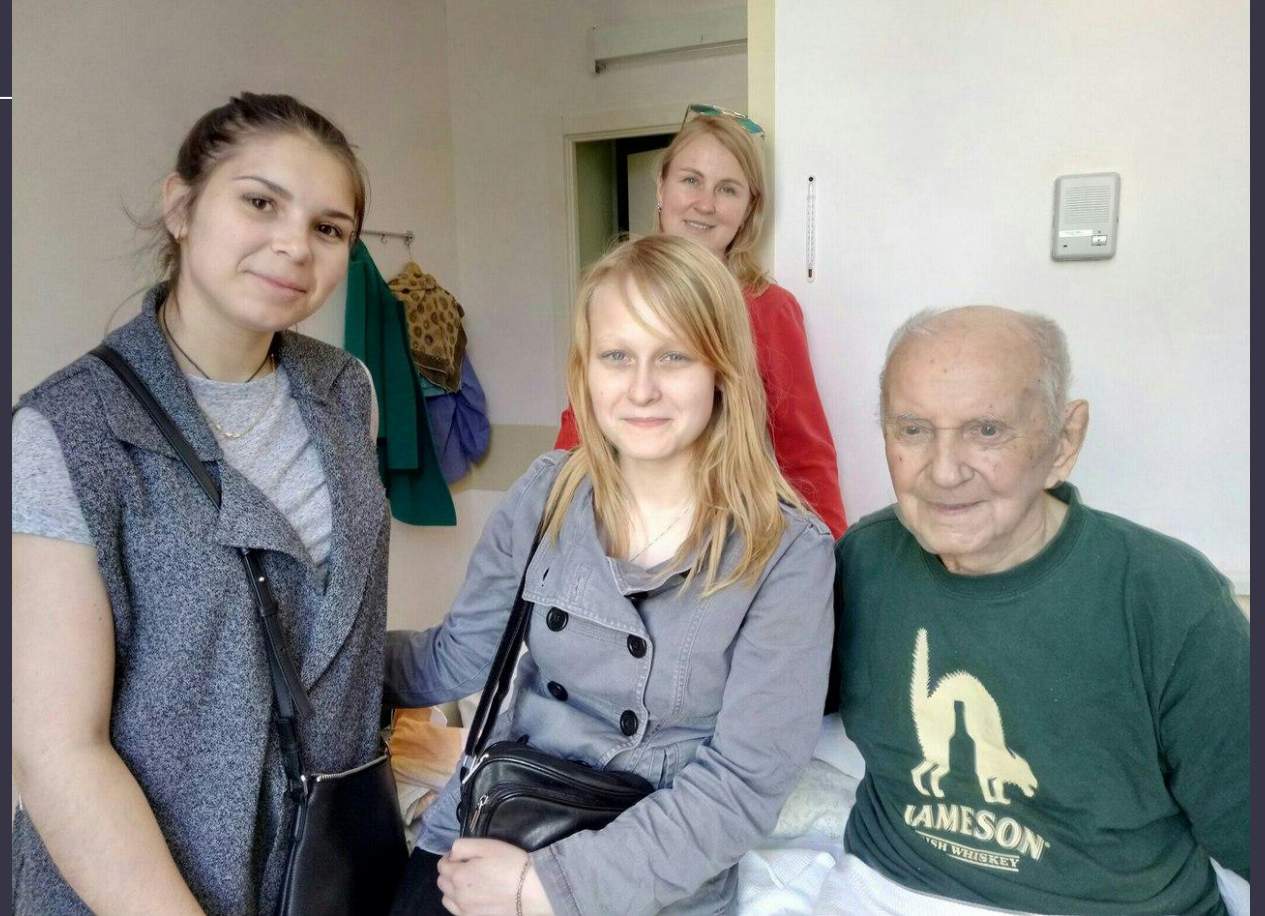
В Военном Клиническом Госпитале встреча с ветераном