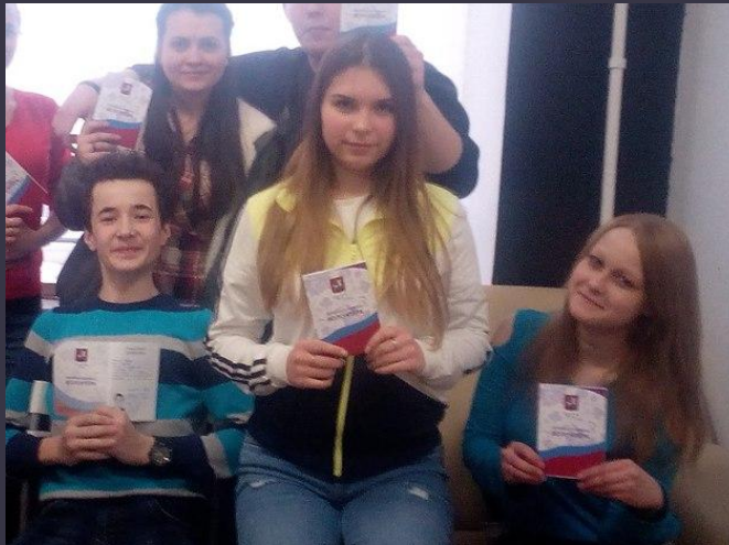
Получение волонтерской книжки