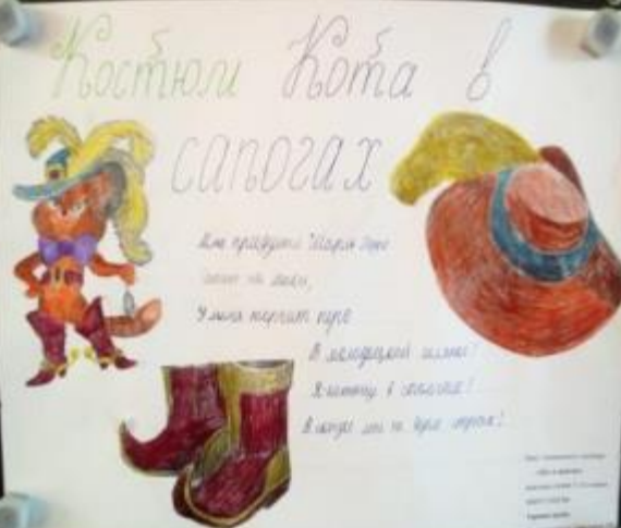
Костюм Кота в сапогах

Как прыгает котик твой Ловит он мышь, Уши торчат вверх В лесочках и в поле! Хвостик и лапки! Всегда он и тебе нужен!