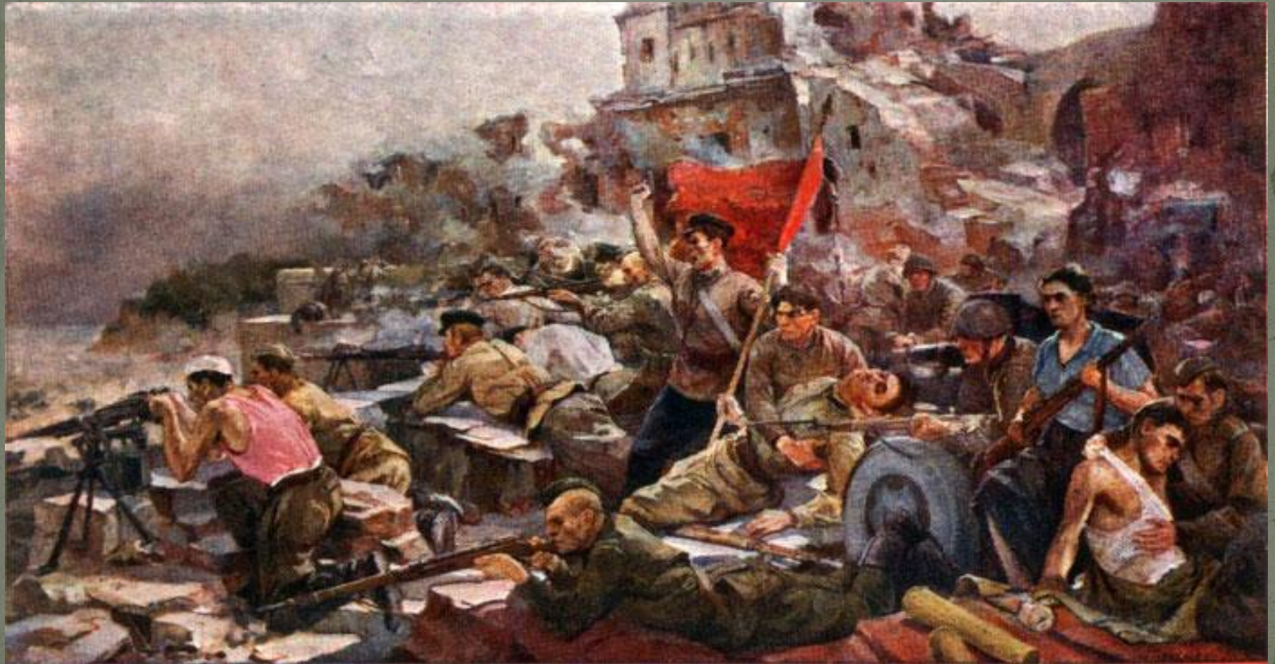
Е Зайцев. Оборона Брестской крепости.

Около месяца продолжалась героическая оборона. Ничто не сломило волю и мужество гарнизона.