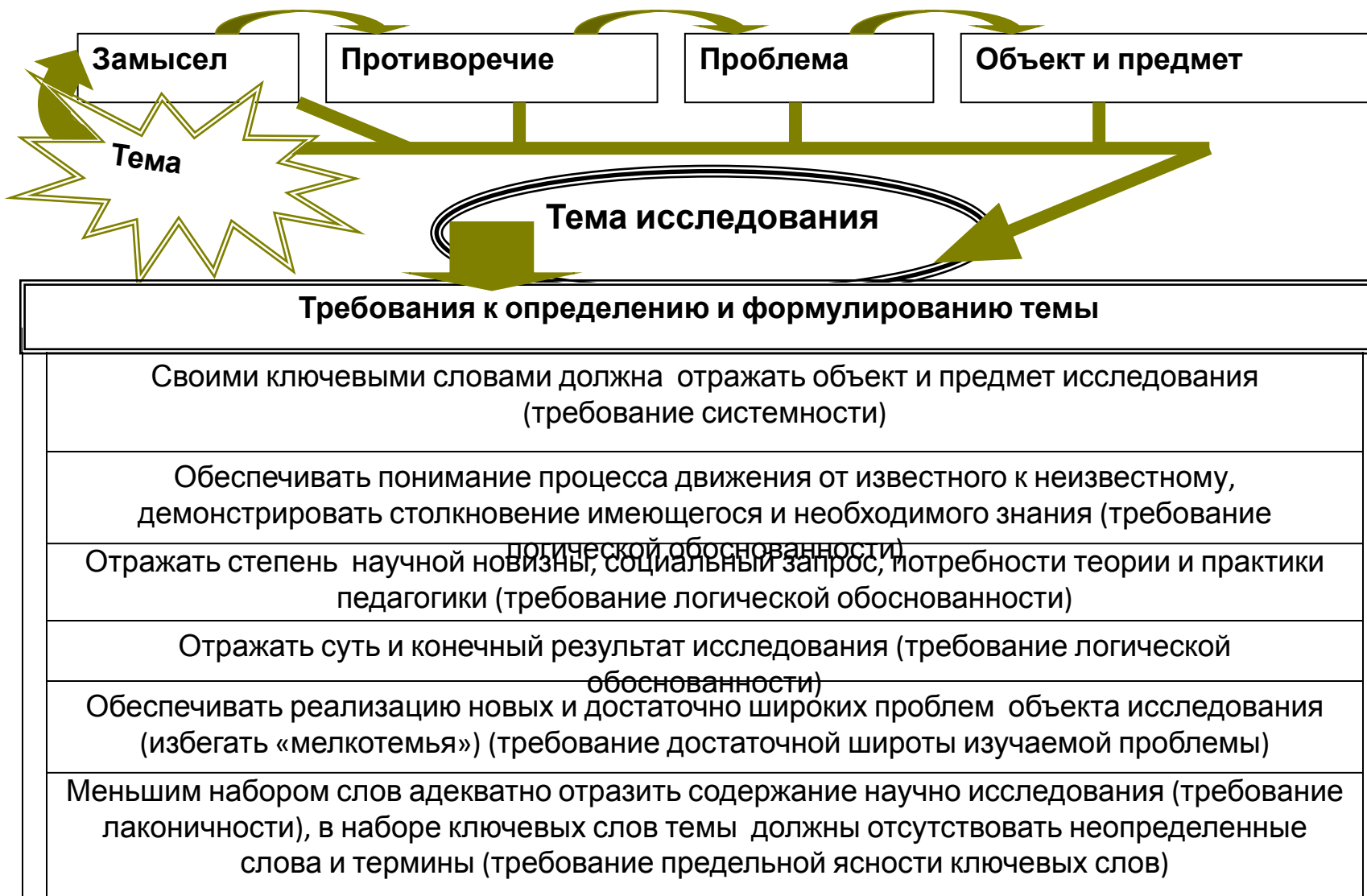
Рис. 111. Тема исследования последовательность ее определения в исследовании