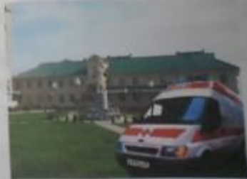
Красноармейский районный дом.