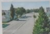
оч. красивая вид от станции