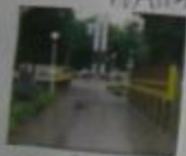
Моя улица, главная в нашем городе