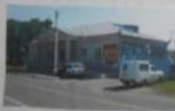
Аптека, аптека Кудачки