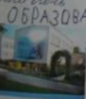
Светлый кафе №20