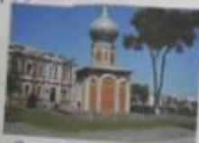
Церковь в центре станции