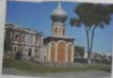
Церковь в центре станции