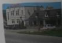
«Светлый кафе» №20