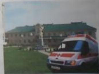
Краснодарский региональный дом.