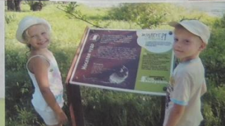
выпускать - мойной гордость