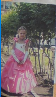
Прощай, детский сад.