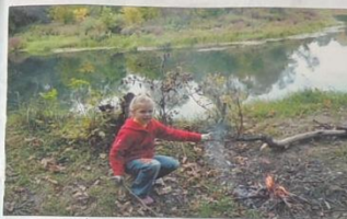
Очень люблю природу моего края!