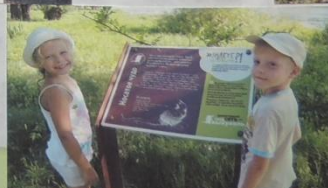
Мой друг всегда рядом.