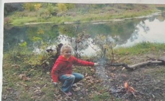
Очень люблю природу моего края!