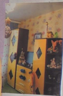
Моя детская комната.

На этих страницах представьте фоторассказ о своей малой родине. Постарайтесь в фотографиях и подписях выразить своё отношение к ней.