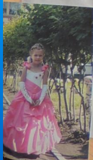
Прощай, детский сад.