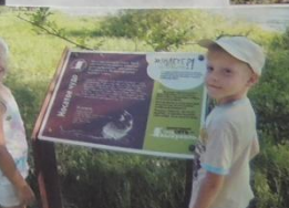
Мой друг всегда рядом.