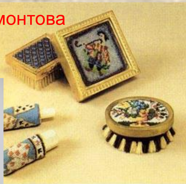
Ломберные щеточки и чехлы на мел. Начало XIX в.