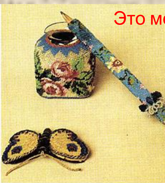
Перочистка, чернильница и карандаш. 1820—1840-е гг.