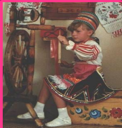
История русского костюма