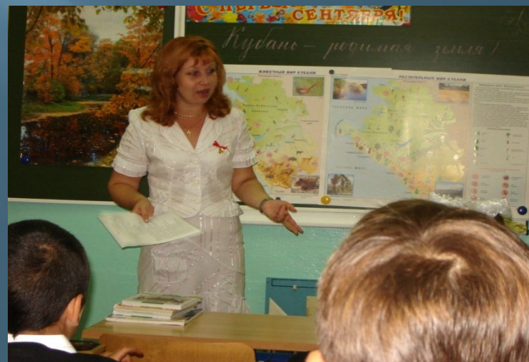
Рассказ, просмотр фильмов