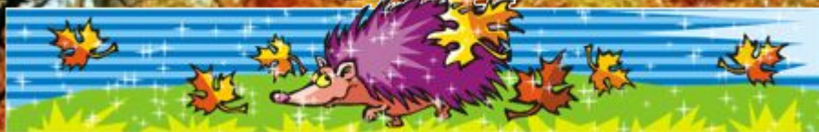
Наблюдения в мире животных