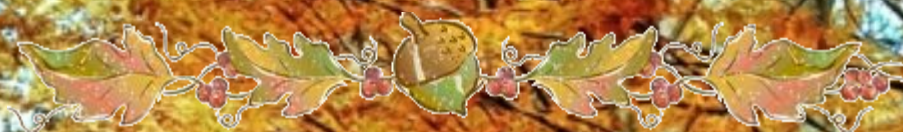
Наблюдения в мире растений