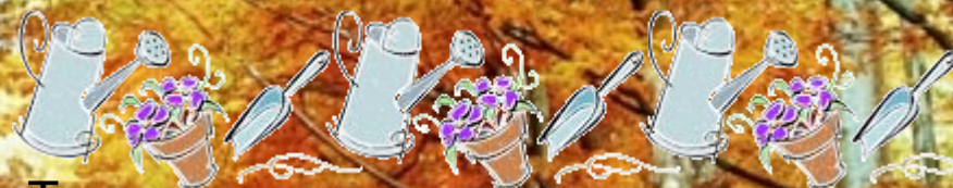
Труд в природе