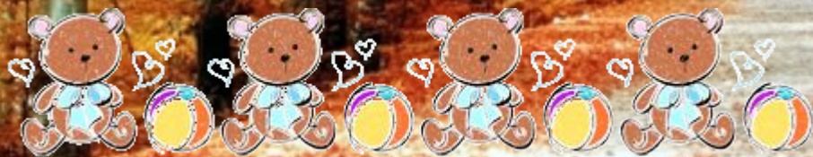
Организация двигательной деятельности