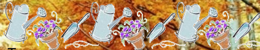
Труд в природе