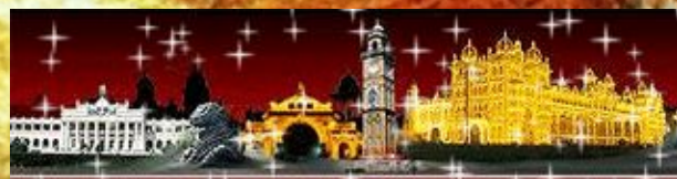
Знакомство с городом