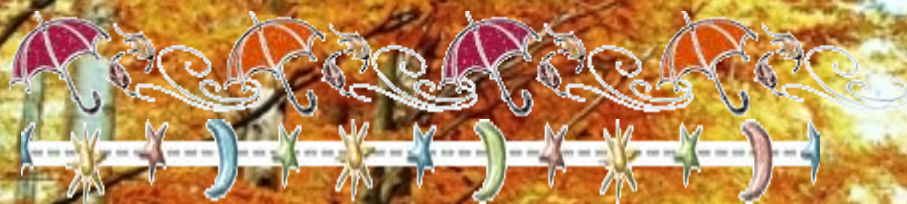
Наблюдения в неживой природе