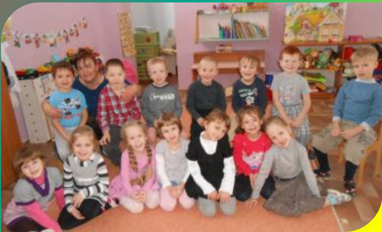
Старшей группы № 4 «Солнышки»