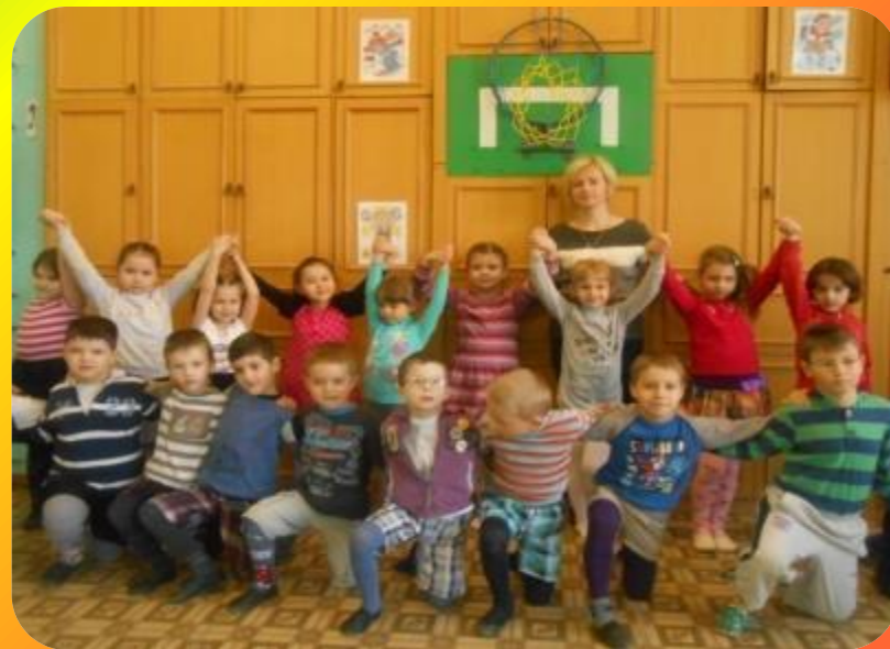
Старшей группы №9 «Звёздочки»