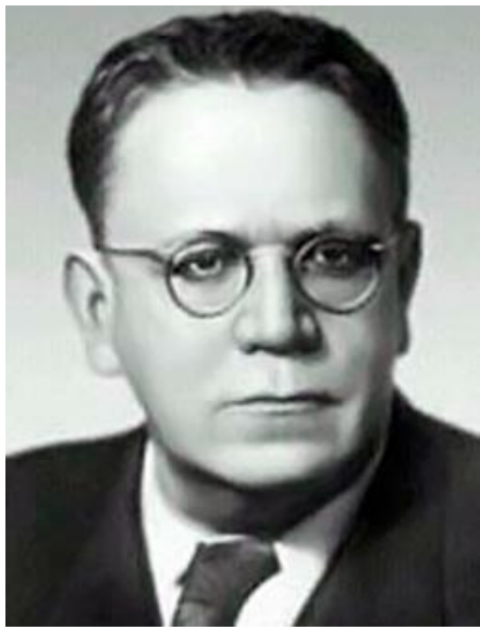
Самуил Яковлевич Маршак